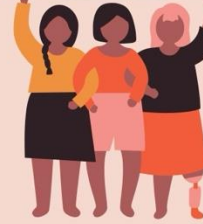
[表7-3]村(里)長選舉候選人及當選人數-按性別分