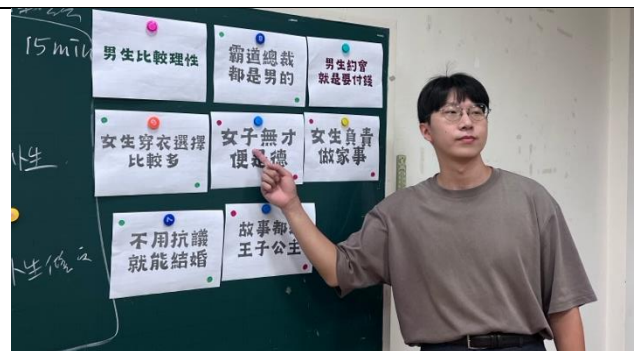
第一節課總結蛇梯活動的內容分類與討論