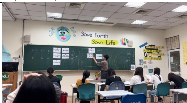
第一節課演示蛇梯活動內容