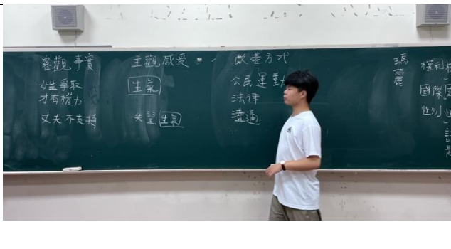
第四節課教師針對學生回應進行統整