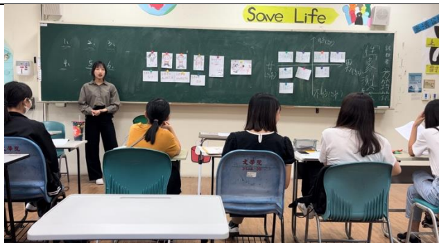
第二節課講解權利公約的相關內容