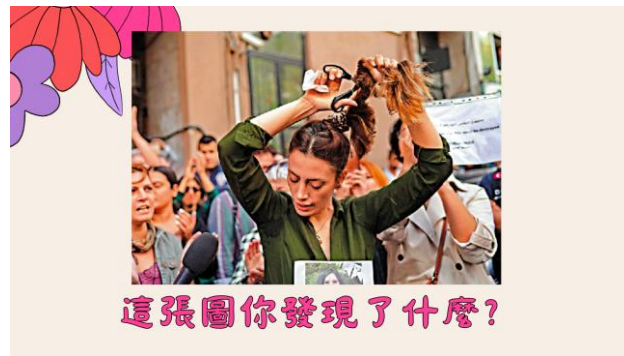
這張圖你發現了什麼？

你有沒有曾經穿過某一些衣服被人說話的經驗？ 你有曾經遇過被禁止穿某一種衣服的經驗嗎？