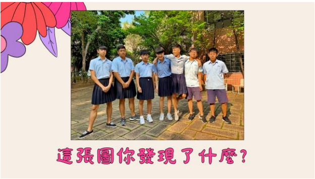
這張圖你發現了什麼？

新北市板橋高中男裙週 板中學生會校慶時舉辦「男裙週」活動引起迴響，板中校務會議近日決定放寬服裝儀容規定，新學年九月開學，板中男生將可以穿裙子上學。校方表示，這是尊重性別平權及學生選擇制服的自主性，依性平法精神，對於板中開放男生穿裙子表示尊重和樂觀其成。 板中原本服儀規定，男生要穿深藍色長褲，女生穿深藍色裙子或長褲，裙子不得短於膝蓋以上十公分。校務會議六月底通過修正案，刪除男生、女生的字句，只規定學生須穿著素面制服的褲子或裙子，以藍色及黑色為主，意味男生也將可穿著制服裙上學。 板中學務主任表示，有女生反應穿裙子不方便，希望開放女生穿長褲，加上學生會五月校慶曾發起「男裙週」活動，讓男生體會到穿裙子不便，因此服儀委員會提案修改服儀規範，並提交校務會議討論通過，這是尊重學生選擇制服的自主權，並鼓勵尊重性別平權。 參考資料：網聚報、林儀雲 (2019) · 板橋高中開放男生穿裙上學 · 自由時報 ·