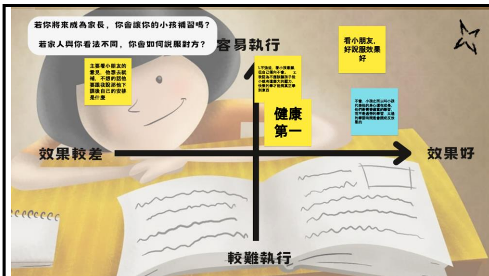
(上圖為【象限圖：點子大集合】的實際執行狀況)