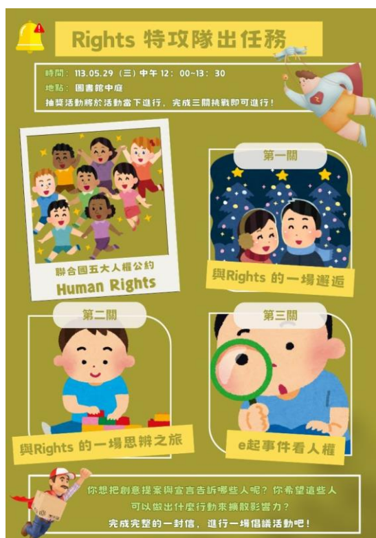
(上圖為【人權週】活動宣傳單內容)

校園內除了於課堂融入教學之外，亦透過「人權週」的舉辦，鼓勵學生探討人權公約、法條與自身之關係。透過結合其他學科內容持續深化學生對國際人權公約之認識。除此之外，還可以與同科教師交流本教案的設計理念和教學內涵，以促進更多的共鳴和推廣。在校園外亦同步進行校際推廣，例如通過校際公開觀課和教案分享，讓更多教師了解此教案。也可以在教師社群中發布和分享，進行推廣。