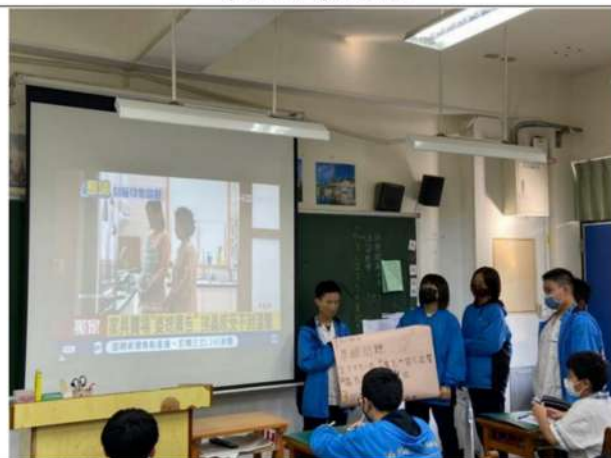
學生進行小組報告