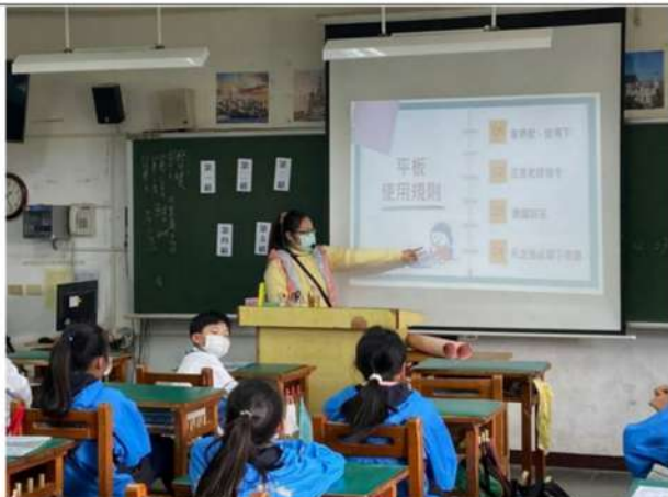
教師說明平板使用規則