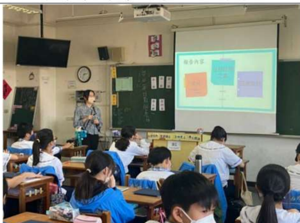
教師說明小組報告內容