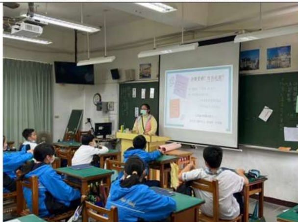
教師揭示教學主題——性別歧視