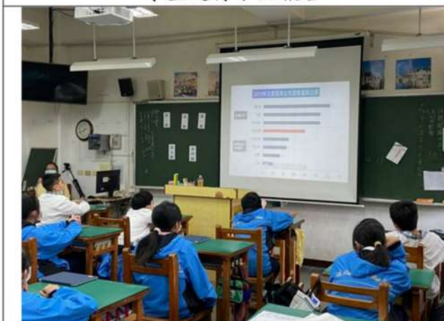
教師播放影片：消除對婦女一切形式歧視公約國家報告在台灣