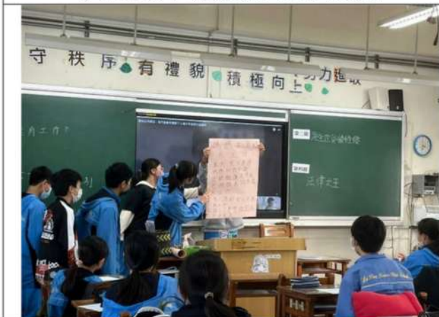
學生進行小組報告