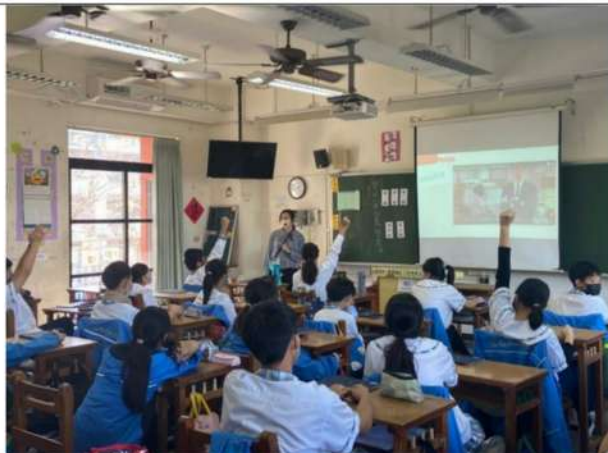
教師請學生舉手回答廣告內容