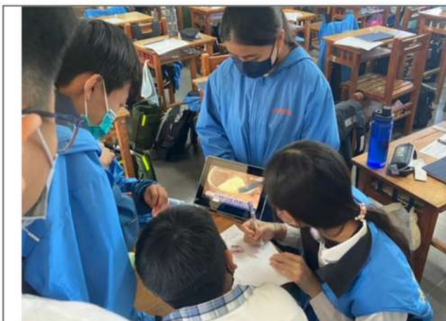
學生透過平板蒐集小組報告資料