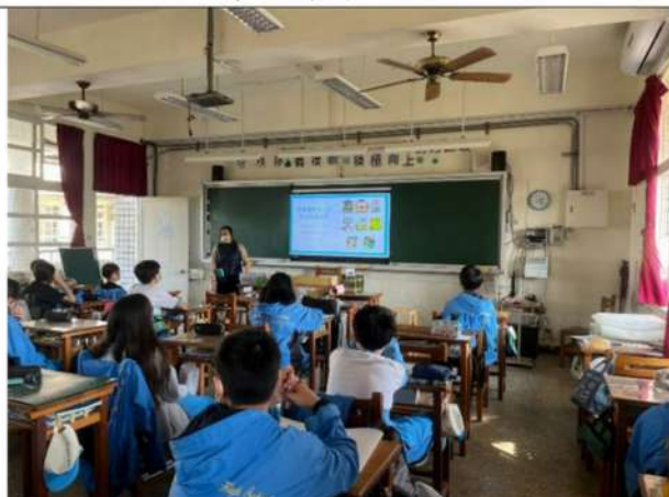
教師介紹「消除對婦女一切形式歧視公約」