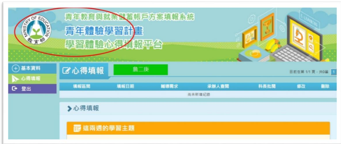
16. 點選上方網頁橫幅可回到雙週誌列表如圖 17