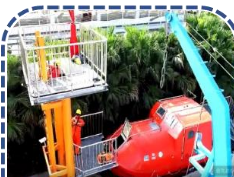
離岸風電產業海事工程菁英訓練基地