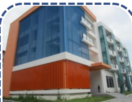
前瞻鐵道機電技術人才培訓基地