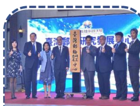
臺灣郵輪研究發展中心