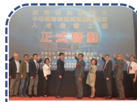
半導體封裝測試類產業環境人才培育工廠