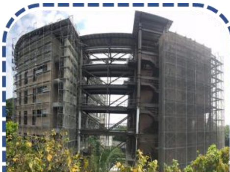
南區災害訓練場暨資材調度中心