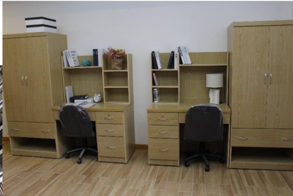
中和圓通雅筑宿舍