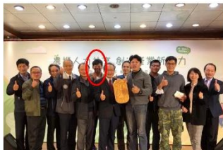
▲農事服務員醫師授證暨團隊學習活動