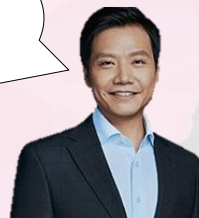
小米手機創始人:雷軍