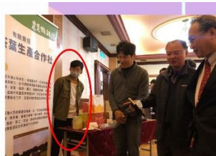
▲農事服務員醫師授證暨成果分享