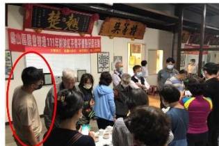
▲農會紅茶製成研習活動