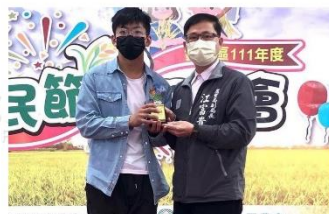
▲農民節頒獎榮獲第二名