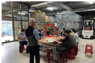
▲職業適性診斷教育訓練