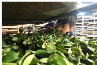
▲比賽掌控好茶葉每個細節的關鍵