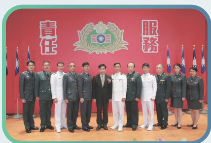
▲ 潘文忠部長與晉任中校階教官合影

今天典禮現場有許多校長、軍訓室主任及聯絡處軍訓督導，一起到現場為今年 7 月晉任的教官來加油打氣，部長也特別謝謝各位軍訓室主任及聯絡處軍訓督導，以及各校校長，能給我們晉任的教官平常在工作上，最好的行政支援及指導，讓他們能夠全力以赴在工作上，對各位表示最大的感謝，而我們教育部軍訓教官，永遠的信念，只要學生所在之處皆是校園，所以教官服務的部分，不只在我們校園內，其實孩子是走動的，事情隨時也可能會發生在其他地方，部長也表示過去疫情期間將近三年多，在教育現場的各位教官，以及聯絡處軍訓督導及軍訓室主任都幫忙學生及校園很多，相信都能夠感受到過往沒有經歷過的防疫過程，無論在校園內或校園以外都是扮演最重要的角色，而且最重要的是，大家能共同齊心協力，讓孩子的學習不中斷，並經歷一次又一次的大型考試，絕不會讓任何一個孩子在臺灣求學，因為疫情的理由，而影響到孩子持續的發展，這些都是教官同仁們在這個階段，投入非常多精神及時間的努力。