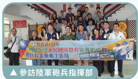
▲ 參訪陸軍砲兵指揮部

吊展示場，館內 44 架中、美、蘇國寶級軍機實體機展示，是我國航空科學教育與知識傳遞交流的專業場所，可瞭解空軍建軍歷史及航空知識。第二站參訪陸軍第四三砲兵指揮部，見證戰備部隊砲操演練，並讓學員親自體驗底火試拉，其中「射擊情境模擬體驗」雖是電子感應槍枝，卻具備了真實後座力、槍聲與煙硝的畫面，部隊還舉辦射擊比賽，由近乎滿靶的學員獲得精美禮品，活動充滿樂趣外，亦讓學員體驗實彈射擊的情境。