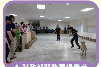
▲ 財政部關務署緝毒犬培育中心緝毒示範

研習也安排參訪財政部關務署緝毒犬中心，該中心是國家防毒的重要機構，所培育之緝毒犬擁有嗅覺敏銳、機動性高及使用範圍廣特性，可彌補人力之不足，加上執檢人員的專業知能及高科技查緝設備投入，達到截毒於關口之目的，阻絕毒品於境外，守護國人的安全，是國家反毒工作不可或缺的一份重要力量。