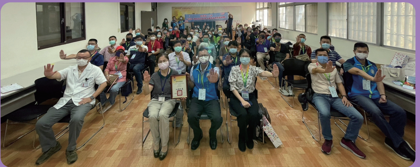
▲ 中區大專校院防制學生藥物濫用知能研習學員合影

教育部表示，此次研習活動不僅讓第一線人員實地瞭解藥物濫用的危害，也為校園防制藥物濫用工作提供了更多實用知識和資源，不管是成人重建的戒毒治療或是邊境的緝毒作業，在在顯示政府對於防制毒品的決心。呼籲各級學校加強校園防制藥物濫用工作，讓「校園零毒品」的種子繼續傳遞，創造健康、安全的學習環境。(校安科 曹詩穎)