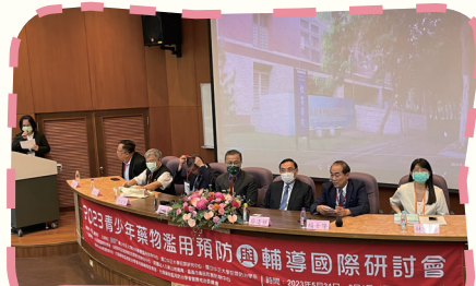
▲ 法務部蔡清祥部長及學務特教司吳林輝司長等人共同主持研討會開幕