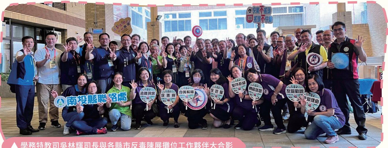
▲ 學務特教司吳林輝司長與各縣市反毒陳展攤位工作夥伴大合影

研討會過程中，學生事務及特殊教育司吳林輝司長偕同與會貴賓，參觀會場周邊由各縣市學生校外會設置的反毒教育成果展示攤位，親自體驗反毒射擊遊戲、AI反毒智能機器人、反毒布袋戲人偶及反毒桌遊等器材，更逐一與各縣市教官同仁及春暉志工合影，感謝所有反毒工作夥伴們的付出，也期待未來能夠達成無毒校園的最終目標。本次活動相關資訊及研習手冊，可至防制藥物濫用教育中心 ( http://deptcrc.ccu.edu.tw ) 下載。(校安科 賴竑融)