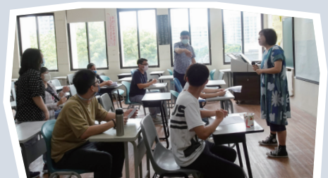
▲ 社交達人教學示範影片拍攝過程

個別化支持計畫 (ISP)，有系統地追蹤輔導，並與家長合作，讓學生能夠在生活中多練習與實踐。他期許未來透過課程的引導，身心障礙學生能夠逐漸提升學生人際溝通技巧，順利融入同儕團體，在大學校園中建立良好的友伴關係。（特教科 陳宛蓁）