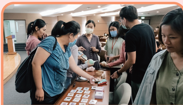
專業輔導人員討論牌卡運用於諮商技術