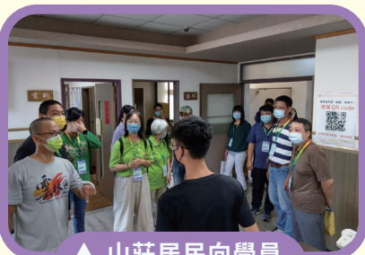
▲ 山莊居民向學員介紹課程及規範

茄荖山莊是國內第一個也是唯一擁有完整醫療專業團隊的戒癮治療性社區，本次知能研習安排