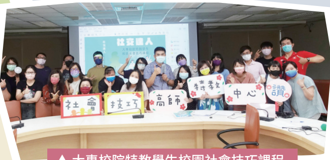
▲ 大專校院特教學生校園社會技巧課程手冊的作者及演員們合影留念