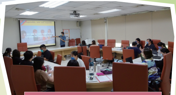
▲ 蔡明富主任與 10 所資源教室輔導人員討論手冊教材理念與架構