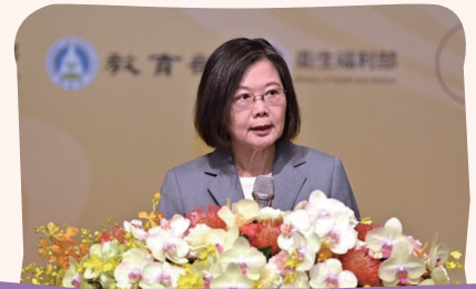
▲ 蔡總統於112年反毒有功人士及團體頒獎典禮致詞並勉勵獲獎單位

本次頒獎典禮「拒毒預防組」出席觀禮人數近百人為歷年之最，除教育部各縣市聯絡處及直轄市政府教育局軍訓督導外，還包含中場表演團體彰化縣香田國小獨輪車隊的學童、帶隊老師及校長等人熱情參與，無不展現教育人員對於反毒活動的支持，教育部學生事務及特殊教育司吳林輝司長也代表潘文忠部長慰勉與會人員辛勞，共同為打造健康無毒的校園環境而努力。