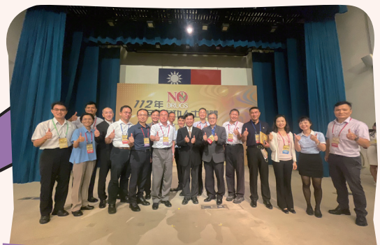
▲ 教育部潘文忠部長、學務特教司吳林輝司長、張惠雯科長各縣市軍訓督導合影