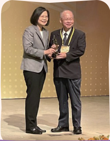
▲ 蔡總統頒發拒毒預防組獲獎人獎座

由教育部、法務部及衛生福利部共同主辦的112年「反毒有功人士及團體」頒獎典禮，今(26)日於國家圖書館盛大舉行，活動中表揚反毒有功人士及相關單位團體，頒獎依任務區分「拒毒預防組」、「防毒監控組」、「緝毒合作組」、「毒品戒治組」4個組別，共計26個單位獲獎。蔡總統親臨致詞勉勵，對所有獲獎單位同仁的努力付出及成果給與肯定！