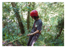
困難地形的通過-繩索垂降課程