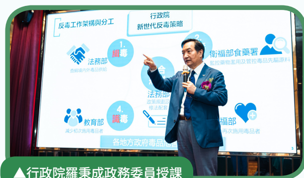
▲行政院羅秉成政務委員授課

參與的學員表示，本次研習收穫滿滿，對於戒癮者願意經驗分享，並投入社會工作者這份辛苦的工作感到感動，看到政委介紹的反毒歷程，也對於能一起投入反毒工作感到榮幸，針對社會資源的連結介紹與科博館的實地參訪所獲得的資訊，也能讓實務上更能加強防制毒品相關知能。(校安科 曹詩穎)