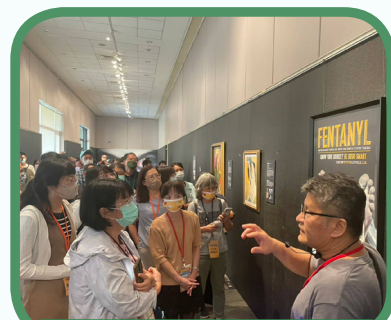
▲臺中科博館楊博士介紹反毒超有梗特展