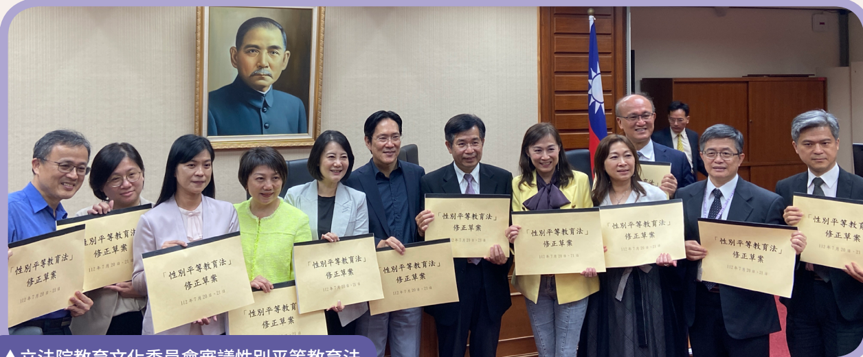
▲立法院教育文化委員會審議性別平等教育法

行政院7月13日院會通過教育部擬具的「性別平等教育法」(以下簡稱性平法)修正草案,函請立法院審議。性平法於民國93年制定,施行已逾19年,歷經5次修正,為促進性別地位實質平等,以教育方式教導尊重多元性別差異,性平法明定於學習環境及學校課程教材中,落實性別平等教育,並規定中央、地方、學校均應設置性別平等教育委員會,如發生校園性侵害、性騷擾、性霸凌等事件,均依照嚴謹調查處理程序保護當事人,也為確保當事人受教權,學校需提供心理輔導、保護措施或其他協助。