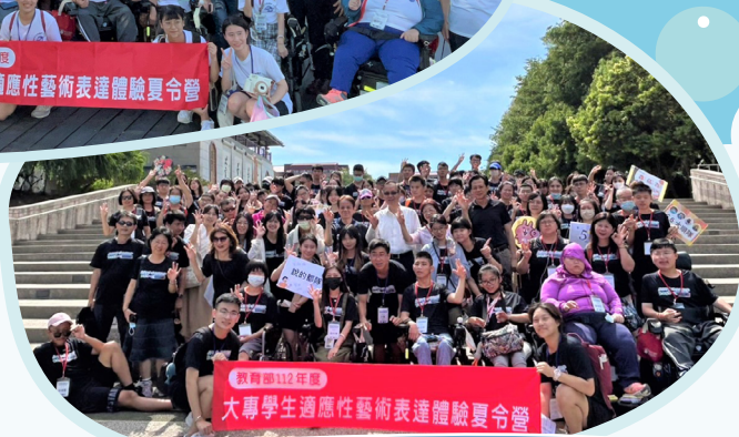
▲藝術夏令營學生到南華大學臺灣生命教育意象館參訪及體驗活動