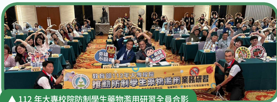
▲ 112 年大專校院防制學生藥物濫用研習全員合影