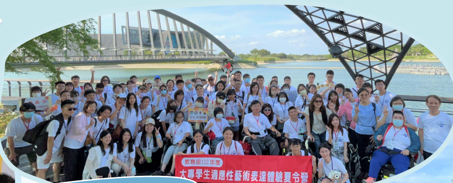
▲普生特生攜手體現融合