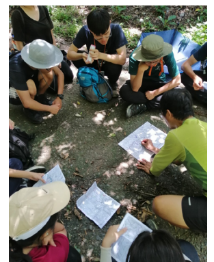
圖上研究與指北針運用