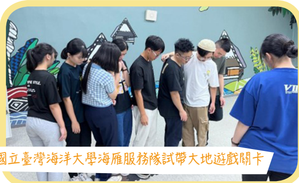
國立臺灣海洋大學海雁服務隊試帶大地遊戲關卡

為鼓勵大專校院學生參與社團活動、提升學生社團健全發展，並強化教育優先區中小學生參加營隊的課外活動資源，教育部補助大專校院學生社團於 112 年暑假期間赴教育優先區中小學校辦理免費營隊活動，除了培養大專學生自我成長、積極奉獻及關愛社會的服務精神，也期許教育優先區中小學生能夠有一個充實、溫暖又精彩的暑假。