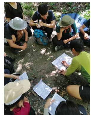
圖上研究與指北針運用