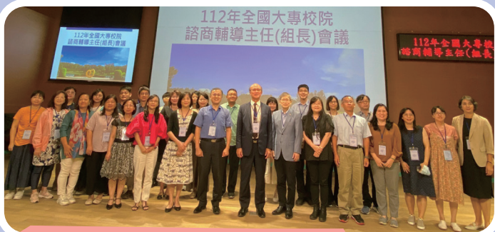
▲ 中區輔導主任（組長）會議合影

教育部期待藉由本次會議，讓各大專校院諮商輔導單位主管共聚一堂，透過相互交流以凝聚共識，使學校能依據輔導對象規劃適性、符合其需求的輔導策略，並提升輔導專業，建構更綿密輔導網絡，讓輔導成效最大化，並提升諮商輔導的品質與效能。（輔導科 洪麗芬）