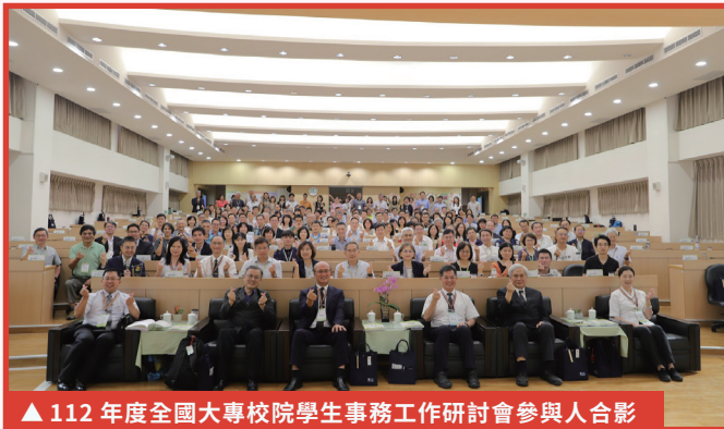
▲ 112 年度全國大專校院學生事務工作研討會參與人合影

為使全國大專校院學生事務長深入瞭解當前學生事務的重要措施及政策重點，促進經驗傳承與互動交流，教育部於 8 月 17 日至 18 日在花蓮慈濟科技大學舉辦「112 年度全國大專校院學生事務工作研討會」。本次研討會以「學務攜手~深耕陪伴」為主軸，開幕式由林騰蛟常務次長主持，並頒獎表揚資深續任及卸任學生事務長共 40 名。