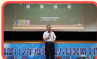
▲ 學務特教司吳林輝司長致詞

吳司長林輝表示，本次研習雖受颱風影響，部分縣（市）同仁無法參與，但從各課程講座與現場同仁互動的狀況來看，本次軍訓同仁在課程當中，對於每個議題都有新的見解，藉由個人相關學務經驗，均能為學務工作注入新的暖流，期許每位軍訓同仁在轉型過程中持續作為穩定校園的力量，妥善規劃未來，為校園安全、全民國防教育、學生生活輔導等各項工作不斷發揮創新思維與做法，更替自己的未來開啟嶄新的生命篇章。