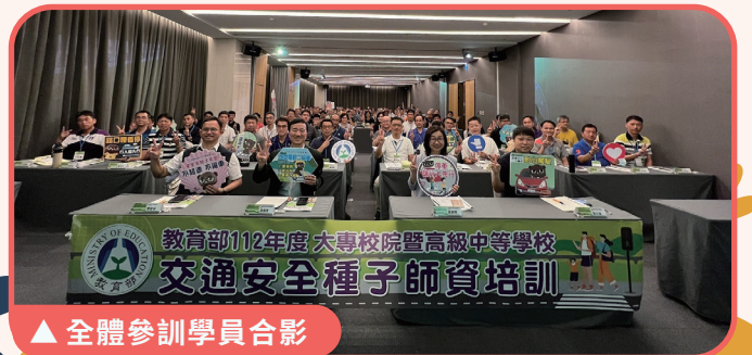
▲ 全體參訓學員合影