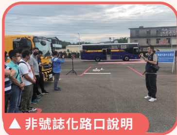
▲ 非號誌化路口說明

鑑於學生機車事故通報件數每年占學校交通意外事件多數，為守護學生騎乘機車安全，教育部與交通部於 112 年 8 月 2 日至 4 日共同辦理「路口安全停讓行人—112 年度大專校院暨高級中等學校交通安全種子師資培訓」，共 120 位學員參訓，希望透過交通安全法規與實務操作課程設計，使參訓人員具備宣講學生交通安全相關知能，以強化校園交通安全宣講師資陣容，擴大宣教成效，能更有效防止學生交通意外事故發生。