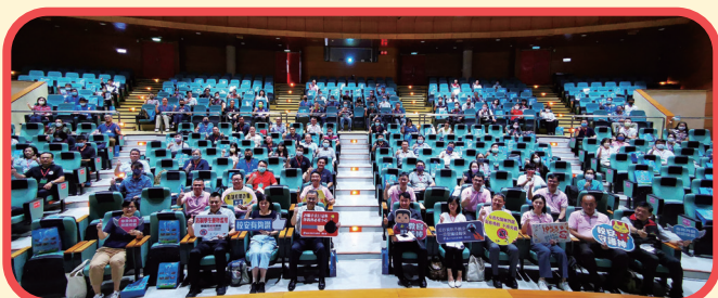
▲ 暑工第二梯次大合影

為增進軍訓人員學能、瞭解全民國防新知、強化學生生活輔導衍生校安事件與性平事件處置能力，藉由每年「軍訓人員暑期工作研習」活動，培養軍訓同仁正確工作理念與處理能力，俾利學務工作的推展與創新。本（112）年度軍訓人員暑期工作研習訂於 7 月 26 日至 7 月 28 日，委由臺中市政府教育局承辦，於國家教育研究院中部辦公室舉行。