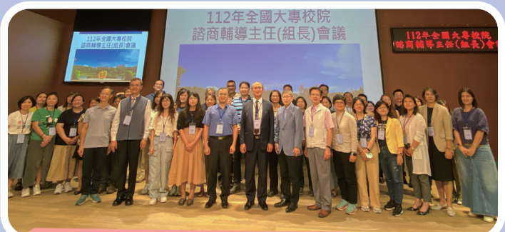
▲ 南區輔導主任（組長）會議合影