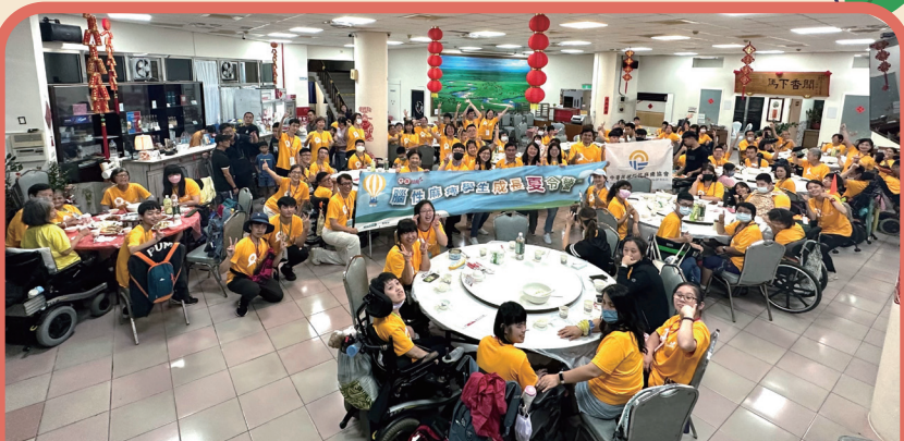
夏令營始業式揭開活動序幕