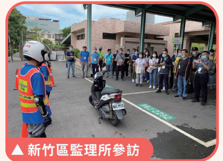
▲ 新竹區監理所參訪

機車是年輕人的主要交通工具，但機車車體脆弱度高，以過快或不適當的駕駛觀念行駛，就容易會造成傷亡事件，藉由本次研習課程，期讓參與學員將交通安全專業知能帶回校園，並以全人教育方向教導「尊重行人」的觀念，運用於相關課程，促使學生具備正確安全駕駛觀念及防制交通意外事故常識，以避免意外傷害發生。