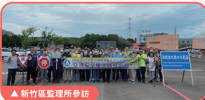
▲ 新竹區監理所參訪

教育部表示，依據行政院頒布第 14 期「道路交通秩序與交通安全改進方案」112 年度工作執行計畫，藉由新編課程、政策說明暨機車安全駕駛實作等交通安全相關課程，精進培訓交通安全種子教官授課知能，教育部除將持續推動辦理各項交通安全維護及相關宣導工作，也呼籲各級學校應落實交通安全教育宣導，適時提醒學生遵守交通規則，期降低學校交通事故之發生，以維護學生生命安全。(校安科 龔紀綸)