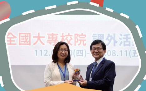
▲ 致贈樹德科技大學感謝牌