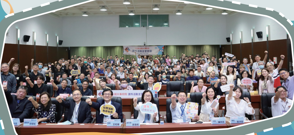
▲ 112 年全國大專校院課外活動主管會議合照

會議以「造正向的浪，揚青春的風」為主題，內容包含專題演講、實務工作坊、學務工作遠端對話及政策宣導說明等。其中，專題演講以「正向團隊經營—成為有領導力的主管」、「激勵帶心術」及「衝突管理」為題，分享領導力、組織團隊及有效溝通法則，期待打造共感共識的韌性正向團隊；而為讓問題能有效討論與聚焦，增進大家在學生事務工作執行的專業知能及實務經驗，實務工作坊分別規劃大師班與成長班實務工作坊，俾深入討論、集思廣益尋得突破之道；學務工作遠端對話則事先蒐集了全國課外活動組員的心聲，期藉由這次的向上溝通，促進彼此瞭解，成為共感、共榮、共好的正向團隊，並進而凝聚全國大專校院課外活動組主管共識，激勵相關人員工作士氣。（學務科 蔡筱如）