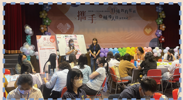
▲ 112 年大專校院特殊教育服務與輔導人員成果分享交流研討會

本年度獲獎人員及學校事蹟均收錄於典禮手冊並製作成果影片，將上傳全國特殊教育資訊網「優良特教人物校園故事」專區（網址： http://special.moe.gov.tw ），提供社會大眾參閱，並期待促進特教工作經驗交流與傳承。（特教科廖浚羽）