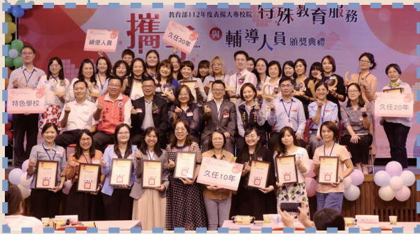
▲ 教育部表揚 112 年度大專校院特殊教育服務與輔導人員獎勵措施獲獎人員合影

教育部為確保身心障礙學生學習權益，同時肯定大專校院特殊教育輔導人員久任及貢獻，並促進工作經驗交流與傳承，以提升特教服務品質，於今（27）日舉辦「112 年度表揚大專校院特殊教育服務與輔導人員頒獎典禮暨研討交流會」，頒發 48 人久任感謝狀。今年獲獎人員中，服務年資滿 30 年有 1 位、滿 20 年有 11 位、滿 10 年有 36 位，服務特教工作事務長達數十年者，其精神令人嘉許與肯定；另表揚 10 位服務績優個人獎及特色學校獎 6 校（名單如附件）。獲獎學校與人員同時也在交流座談會中分享特教工作的心得，透過經驗的討論與薈萃過程，為特教工作加添多元融合的集體智慧。