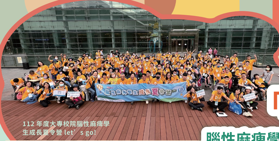
112 年度大專校院腦性麻痺學生成長夏令營 let's go!