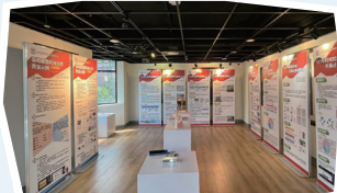
▲全民國防教育學科中心陳展區

於活動開場時，邀請桃園市政府教育局劉仲成局長蒞臨共同研討，並請臺北市、新北市、桃園市、基隆市及新竹市政府教育局（處）全民國防教育與防衛動員業務相關承辦人到場觀摩。