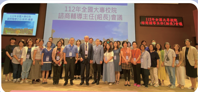
▲ 北二區輔導主任（組長）會議合影