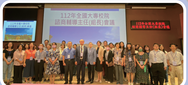
▲ 北一區輔導主任（組長）會議合影