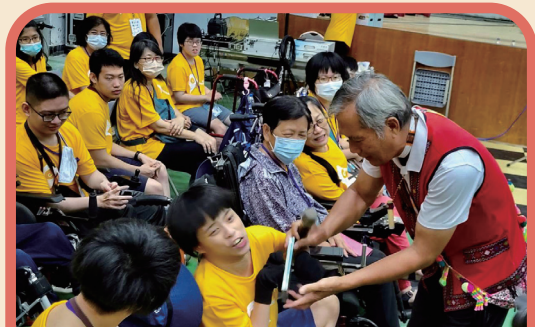
多元融合，腦麻學生進行原民文化體驗