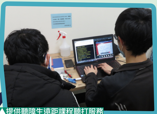
▲提供聽障生遠距課程聽打服務

本校於 104 學年度第 2 學期建立完整的聽打服務制度，草創之初，大力宣傳並鼓勵聽障生申請聽打服務，然聽障生因為之前的經驗，一方面不想麻煩別人，一方面覺得聽打效果不佳，擔心授課教授可能因不瞭解聽打服務而有所誤會，申請意願並不高。不過，在筆者不斷鼓勵之下，聽障生慢慢有意願加入：參加培訓、借課申請並提供意見；另一方面，草創期為了能快速拓展聽打服務，前兩個學期都開設了十場次的培訓課，也招募全校不分學制與年級的同學，讓更多有興趣的同學認識聽障與聽打服務，也曾寫過校訊文章、於校慶活