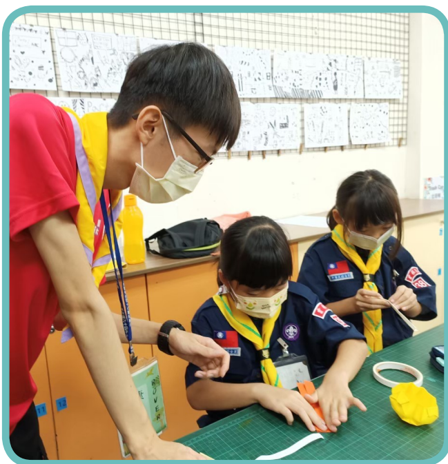
▲國立雲林科技大學雲大羅浮群社團教導雲林國小學生萬聖節手工藝

為讓學生社團活動能夠向下紮根、永續發展，引導學生參與正向課外活動，並提升社會參與的精神與能力，教育部補助各大專校院申請辦理「帶動中小學社團發展計畫」，111 年度共補助 53 所大專校院 207 個社團執行 265 個計畫，計 3,259 位服務志工至 265 所中小學帶動社團發展，參與活動的中小學學童達 1 萬 248 人次。