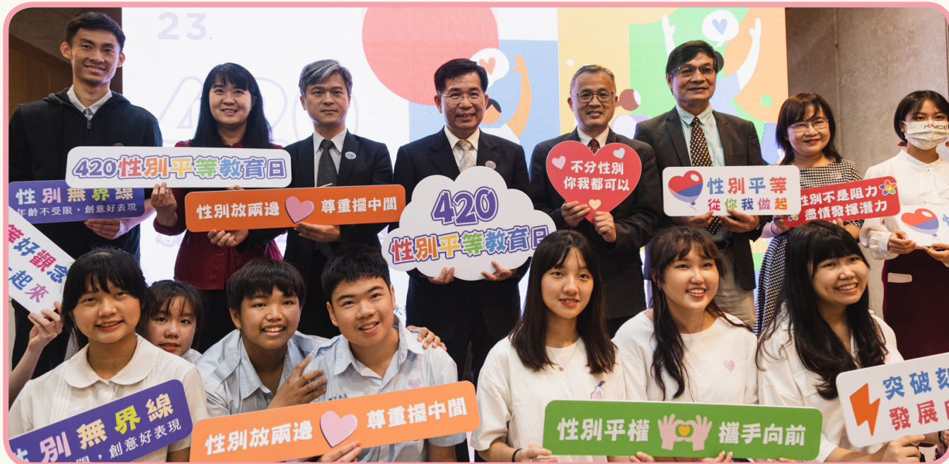
▲教育部性別平等教育日記者會

為使學校更加重視性別平等教育推動，深化性別平等教育在校園的實踐，教育部自今（112）年起訂定每年4月20日為性別平等教育日，並於今（20）日在國家圖書館舉辦「420性別平等教育日」活動，邀請教育部性別平等教育委員會委員現場共同回顧性別平等教育的推動歷程，同時於國家圖書館等8個場館同步