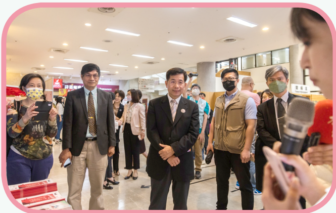
▲教育部長潘文忠參觀「關於月經的點點滴滴特展」

教育部表示，期待透過性別平等教育，可以使任何人都能不因性別、性別特徵、性別特質、性別認同及性傾向的不同受到差別待遇，讓未來的每一天都是性別平等教育日，以營造性別友善、尊重多元的校園環境。（性輔科 林沛雨）