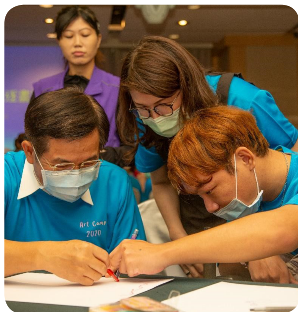
潘文忠部長與學生共同體驗追逐遊戲畫

相關活動內容及報名簡章，請至活動網站（ https://reurl.cc/6NObzM ）查詢或下載。（特教科 廖浚羽）