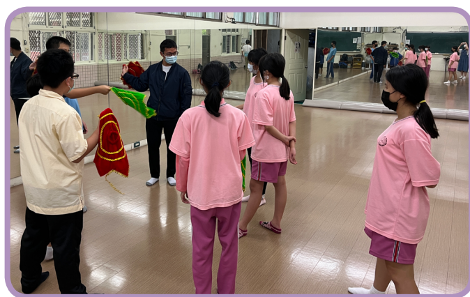
▲國立臺灣師範大學歌仔戲社引導木柵國中學生使用歌仔戲道具八角巾