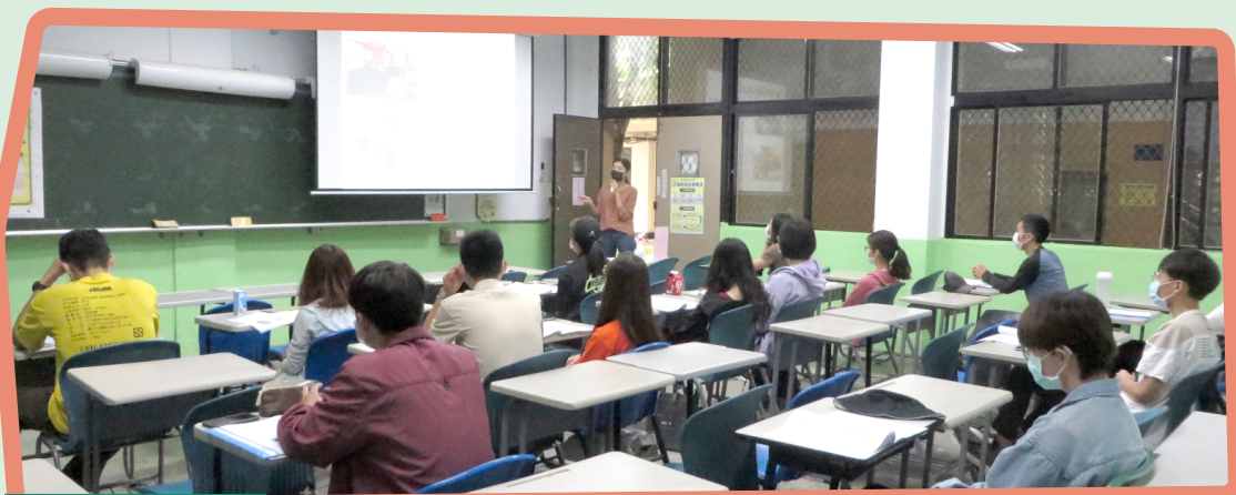
▲聽打筆抄期初培訓

一轉眼，聽打制度在校內順利運作了7年多，從一開始爭取校內行政單位支持調整聽打員的薪資高於一般工讀生，甚至針對實習、正式及取得校外聽打培訓證書等身分提供不同薪資，藉由每學期辦理培訓不間斷，自己帶領培訓相關工作雖然很繁瑣，但也能最直接看到學生們的感受過程。最後，非常鼓勵校內學生發展自己的斜槓專長，參與校外聽打培訓，以為更多有需要的聽障者服務！