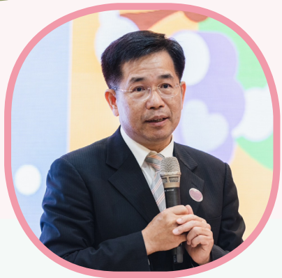
▲教育部長潘文忠於記者會上宣布 每年4月20日為性別平等教育日

法」草案，在93年制定公布為「性別平等教育法」，希望透過性別平等教育法，促使學校注意性別弱勢者處境，以厚植並建立性別平等之教育資源與環境。