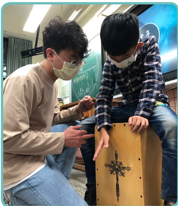
▲勤益科大 - 弦音吉他社 - 臺中市太平國小 - 吉他教學

大專校院學生社團透過規劃及設計一系列活動並引導中小學生參與體驗的過程，不僅得以落實大學社會責任(USR)、磨練社會參與所需的多元化能力、提升中小學生的課外活動資源，參與的中小學校學生也可以擴展學業以外的視野、豐富美感體驗及探索正向的課餘興趣，讓學生社團活動的教育功能可以永續發展，透過正向的課餘活動，陶冶學生的全人化素養。(學輔科 蔡筱如)