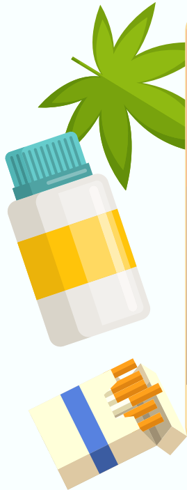
▲破解網路涉毒危機海報