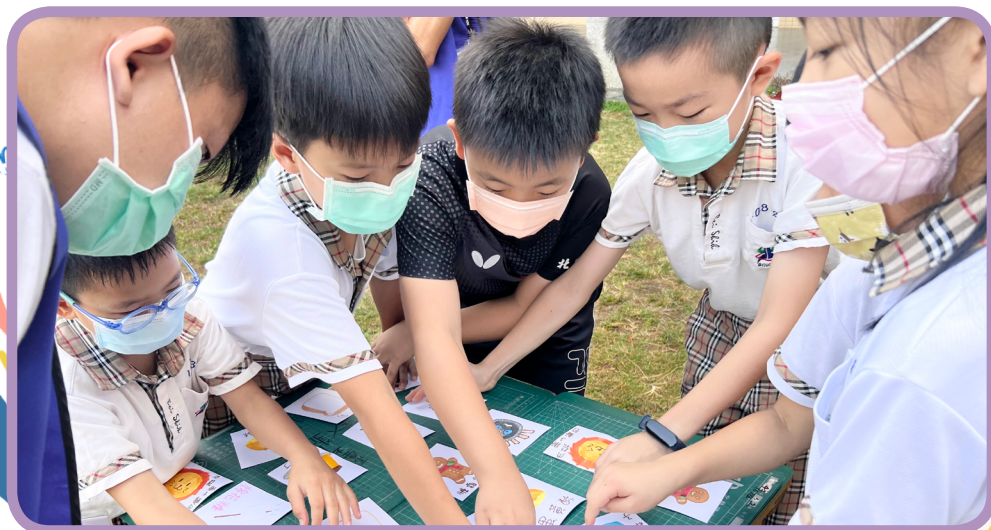
▲弘光科技大學多元廚藝烘焙社利用搶卡牌讓學生認識更多點心食物

各大專校院學生社團與鄰近社區的中小學校進行合作，結合自身專長領域辦理定期社團活動，帶領中小學小朋友擴展課外視野，並藉以發展多元化素養、體驗創新設計思維活動及培養對美善事物的賞析與生活適應能力。申請社團類型包括：（1）學術性、學藝性社團：以學術研究或文藝、技藝教學為主要宗旨；（2）服務性社團：