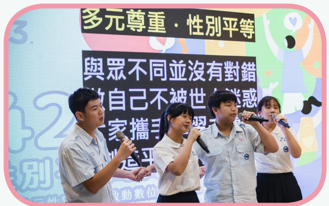
▲學生表演自創性別平等教育歌曲