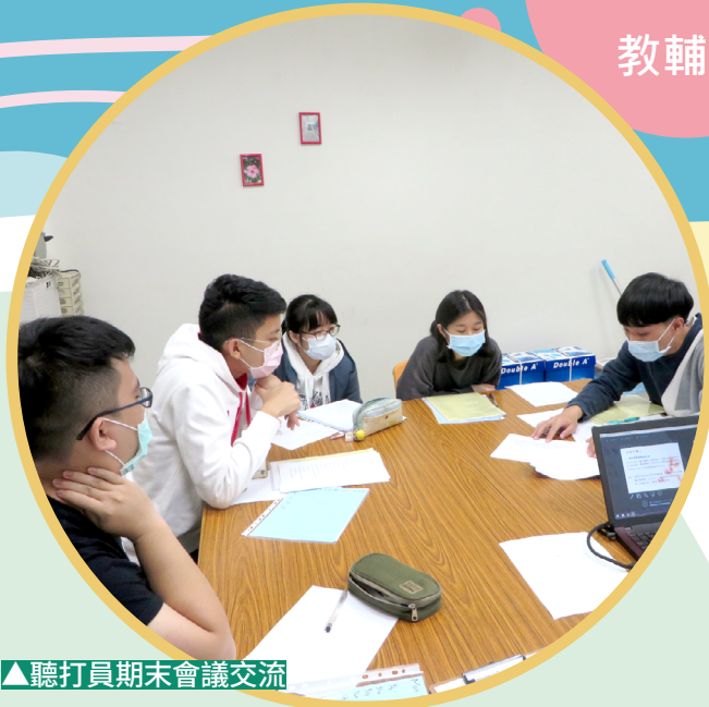
▲聽打員期末會議交流

入班聽打服務要進入每個課堂的第一堂課前，我們規劃由聽打員轉交任課老師知會信函並加以說明，獲得教授的同意後始入班聽打；曾有聽打員和我分享，任課教師很喜歡和聽打員互動，這讓他們好氣又好笑，因為聽打員為了提供好品質的服務，從不缺席、位置都坐前排，且都全神貫注於課堂中教師講的每句話，再加以快速記錄，應該是班上