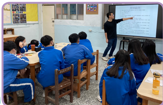
▲國立臺灣海洋大學主持團至瑞芳國中導引學生練習主持稿架構