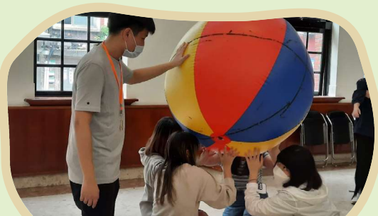
▲ 國立臺北教育大學關懷台灣志工隊 - 營隊遊戲道具製作與實際演練

大專學生社團結合自身專門領域，融入生命、品德、人權及法治教育、性別平等、社區服務、資訊輔導、識毒宣導、美感教育及多元文化等營隊主題，規劃富有教育意涵的活動內容，教育部期盼讓參與的大專校院學生能在過程中培養社會所需多元能力，同時提升教育優先區中小學生的課外活動資源，讓學生社團活動的教育功能得以充分發展。（學生事務科 蔡筱如）