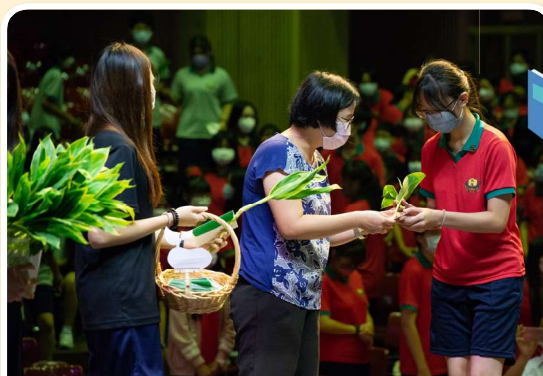
▲ 文藻外語大學辦理專科部新生祈福禮，由導師贈與新生幸運竹與學長姊祝福小卡，期盼新生如同竹子般節節成長。

教育部表示，在「教育部生命教育推動方案」的帶動下，持續配合「大專校院辦理生命教育校園文化推廣與深耕計畫」與「大專校院辦理生命教育教學社群與課程發展實施計畫」，鼓勵學校運用各項非正式課程、潛在課程等多元方式與活動，引導孩子思考生命的價值，讓生命教育透過傳承、資源與經驗共享，用愛與希望陪伴孩子成長，讓孩子在校園中快樂學習並成為更好的自己。(學生事務科 張立安)