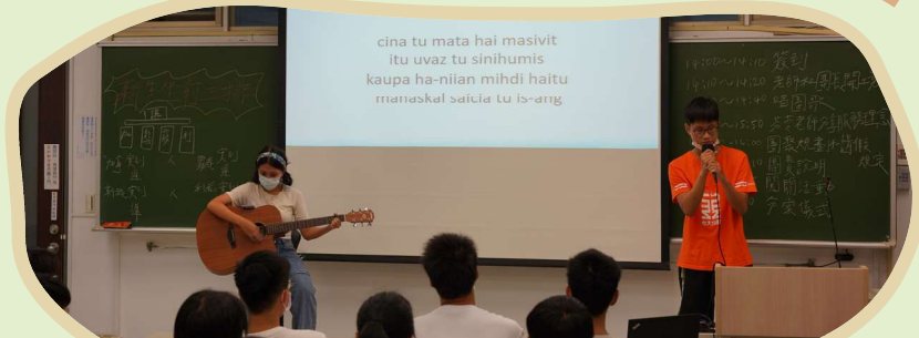
▲ 國立臺灣大學慈幼會山地服務團營隊活動籌備練習