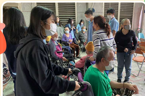
▲ 聖母護專學生藉由實地參與社區及機構的服務，讓學生體驗服務需要發自內心的愛，將這份愛內化並延續。