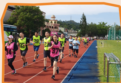
▲ 本梯次學員進行 3000 公尺體能鑑測實況