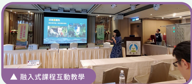
▲ 融入式課程互動教學