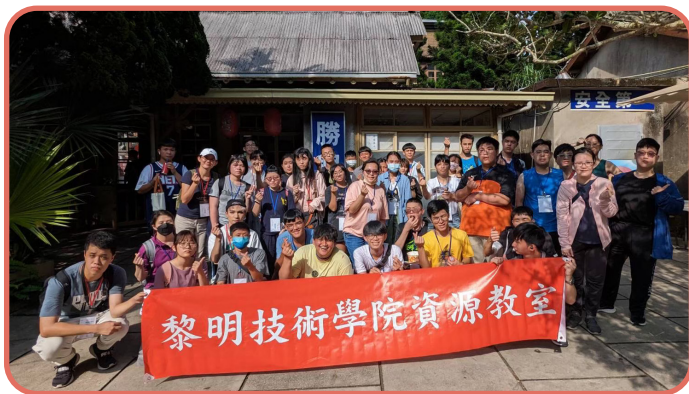
▲ 資源教室辦理生命教育體驗營，帶領特殊生戶外體驗，感受生命的價值，提升自我信心