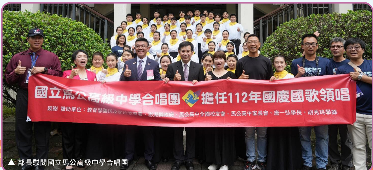
▲ 部長慰問國立馬公高級中學合唱團

另因應本次大會主題，壓軸演出的是國立傳統藝術中心「獅吼震雲端、群獅護臺灣」，以臺灣特色獅陣集結 18 頭不同風格的舞獅，結合傳統陣頭文化與當代劇場美學，傳達新臺灣精神，共同打造獨樹一格的臺灣傳統藝術文化新風貌，同時做為序幕暖場活動結尾。