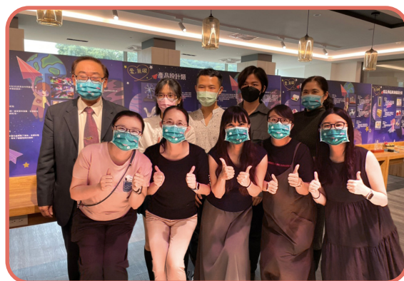
▲ 辦理「愛。無礙作品展」，鼓勵特教生發揮才能創造無限可能