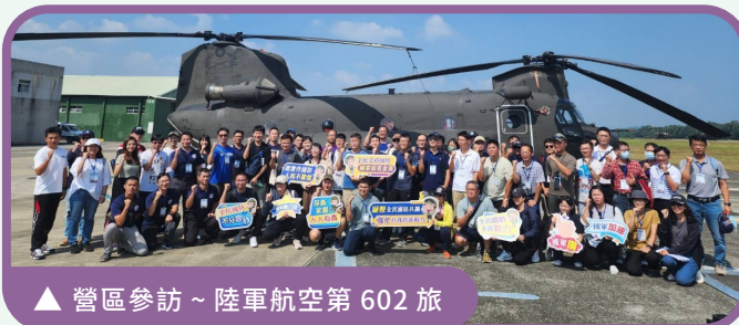
▲ 營區參訪 ~ 陸軍航空第 602 旅