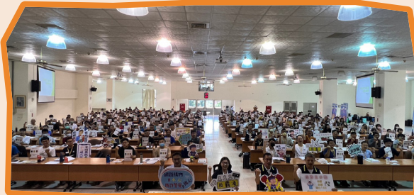
▲ 教育部 112 年高級中等以上學校校安（含學務創新）儲備人員推薦培訓第 2 梯次全體學員合影