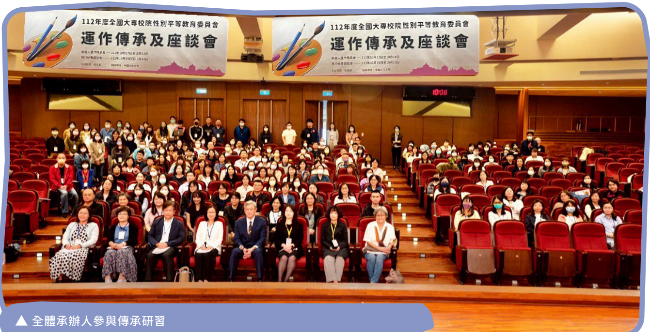
▲ 全體承辦人參與傳承研習