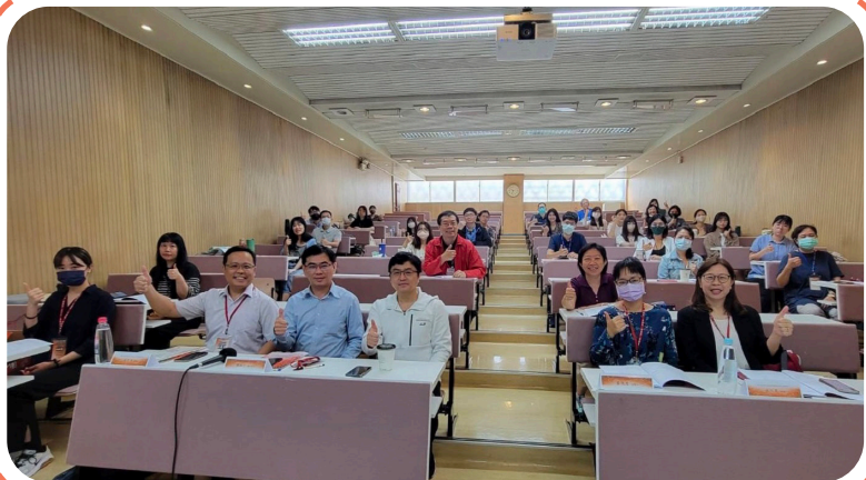
▲ 112 年度網路沈迷輔導知能研習大合照

教育部希望透過本次研習，增強專業輔導人員及教師辨識個案的覺察能力及輔導知能，期許專業人員在陪伴學生探索與經歷的過程中，保持彈性與開放的態度，鼓勵學校善用網路習慣使用量表等工具，作為及早辨別個案與輔助評估的依據之一，並運用多元輔導策略來因應網路沉迷（成癮）事件，幫助學生平衡現實與虛擬生活。（學輔科 柯鈺萱）