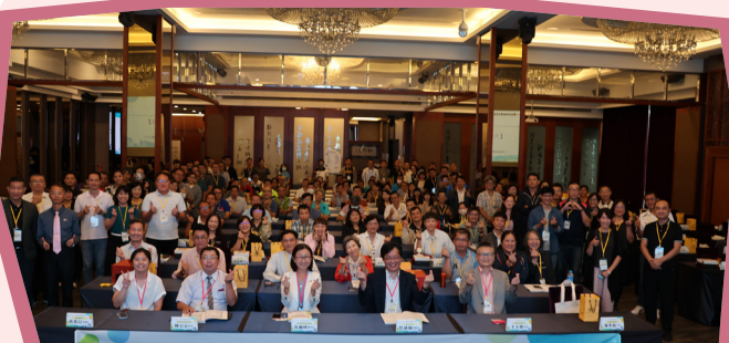
▲ 112 年全國大專校院學生生活輔導主管會議大合照

教育部於 112 年 10 月 12 日及 13 日委請國立中正大學辦理「112 年全國大專校院新任學生生活輔導主管研習」，學務特教司黃蘭琇副司長感謝全國學生生活輔導夥伴的付出與用心，本次會議匯聚全國各大專校院學生生活輔導主管近 200 人，並致贈感謝牌給資深續 / 卸任學生生活輔導組主管共 36 名，以慰勉其於學生輔導工作中無私的奉獻。