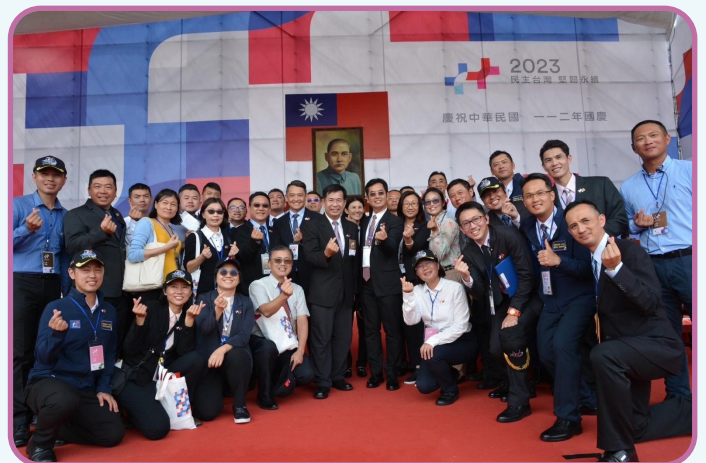
▲ 部長與 112 年國慶籌備委員會大會處同仁於觀禮臺合影