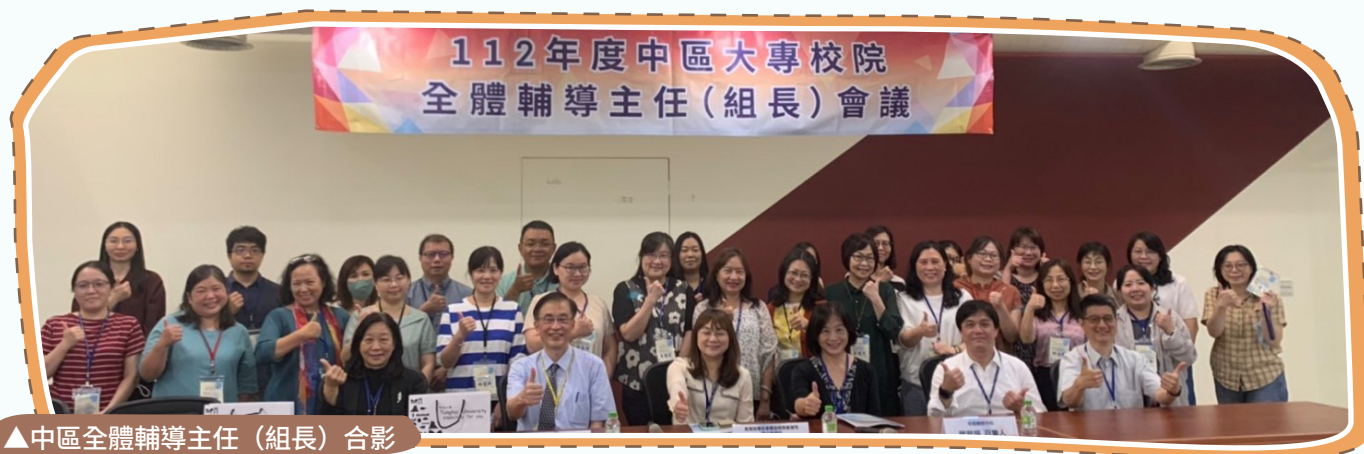
▲中區全體輔導主任（組長）合影

本部期待各輔諮中心主管能藉著分區會議的辦理，彼此相互觀摩學習及經驗交流傳承，讓學生輔導工作推動更加順暢。（學輔科 洪麗芬）