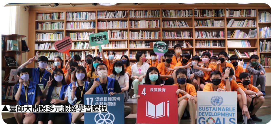
▲ 臺師大開設多元服務學習課程

教育部則表示，期盼在特色主題計畫的帶動下，不僅提升學生事務與輔導工作的專業，更能促使各校發展其特色，並營造優質學習環境，以增進學生全方位的發展。（學務科 王靜芳）