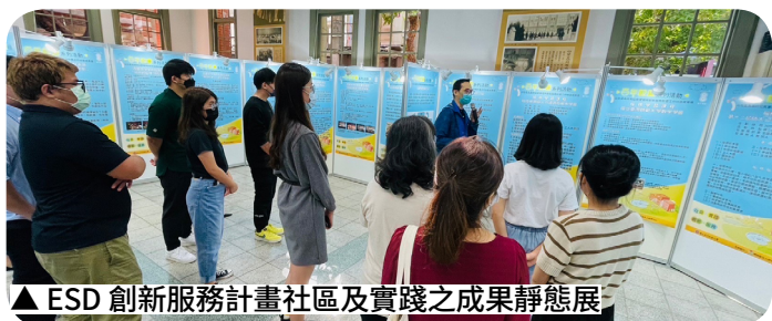
▲ ESD 創新服務計畫社區及實踐之成果靜態展

為協助大專校院推動學生事務及輔導工作，教育部每年擇優補助公立大專校院辦理「學生事務與輔導工作特色主題計畫」，針對人權法治、校園安全及反毒、公民品德、學生社團、生命教育、性別平等教育、網路沈迷輔導等議題，提出為期3年的中長程發展計畫，以落實並塑造具特色之學生事務與輔導工作，111年度共有22所公立大專校院獲得補助。