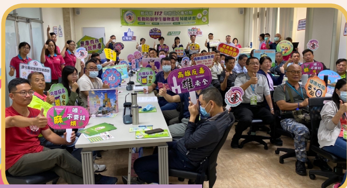
▲南區大專知能研習與學員合影

教育部表示此次研習活動成功達到了預期目標，除了為校園防制藥物濫用工作提供了更多實用知識和資源，更鼓勵大專校院繼續加強校園防制藥物濫用工作，持續推動相關教育，為學生創造一個健康、安全的學習環境。