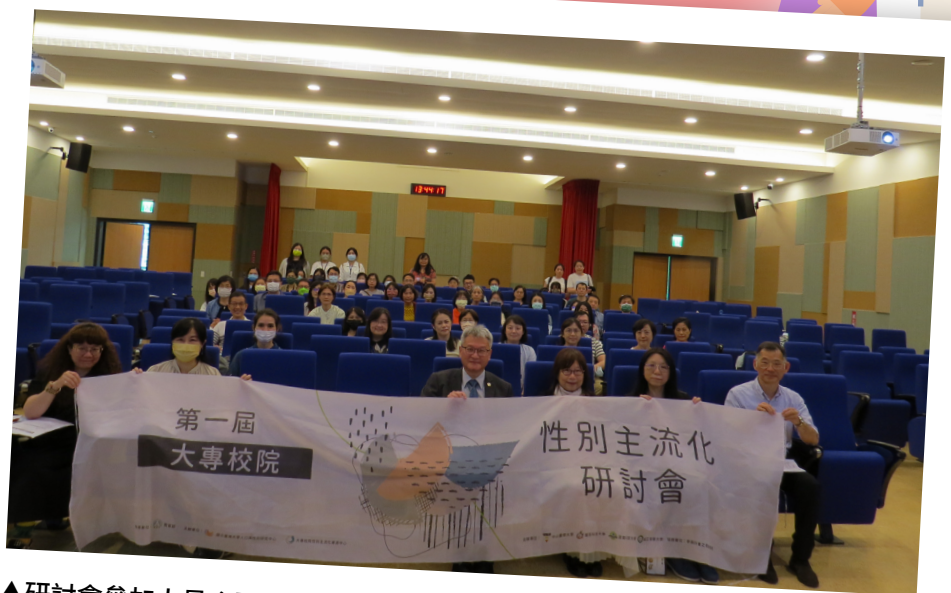
▲研討會參加人員合影