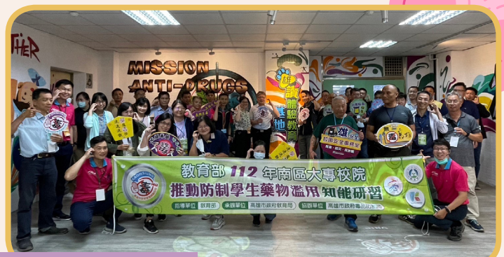
▲雄讚體驗教育基地