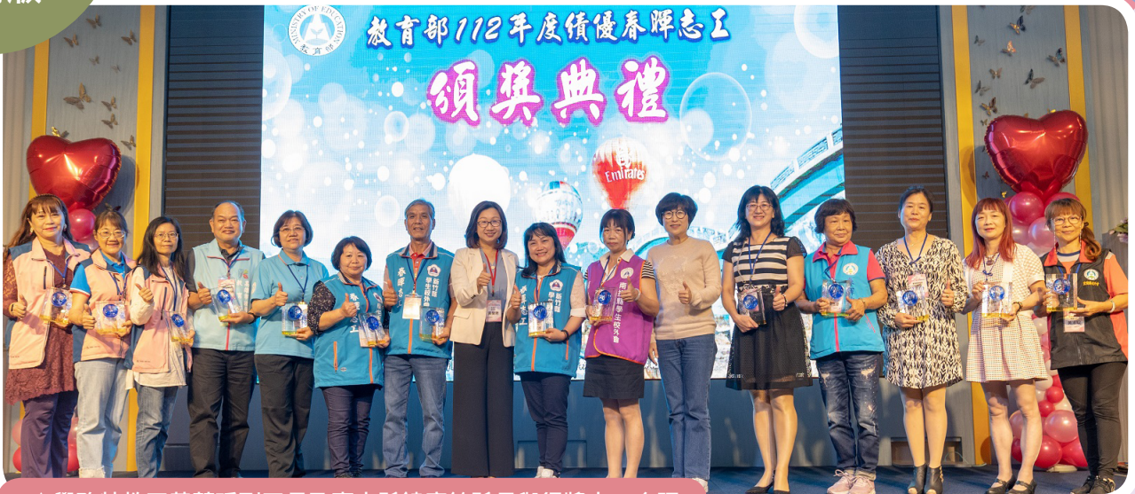
▲學務特教司黃蘭琇副司長及臺東縣饒慶鈴縣長與得獎志工合照