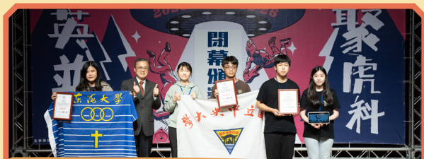
▲ 教育部學務特教司吳林輝司長頒發大專校院學術性、學藝性社團特優獎