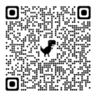
活動專頁 QR Code

此外，本次展覽場館位於彰化縣員林市，主辦單位首次安排跨縣市學校的學生團體參訪，除了彰化地區外，另邀請南投縣20多所國、高中學校組團參訪，期能提升更多學子識毒知能免於遭受受毒品危害。為了活動宣傳並傳達健康、美好的城市形象，教育部潘文忠部長與彰化縣王惠美縣長親自錄製行銷短片，與彰化在地學生代表一同入鏡，鼓勵民眾踴躍前往參觀，共同為打造無毒健康的幸福家園努力。想了解反毒教育特展更多訊息，歡迎掃描下方活動QR Code或上教育部防制學生藥物濫用FB粉絲團。(校安科賴竑融)