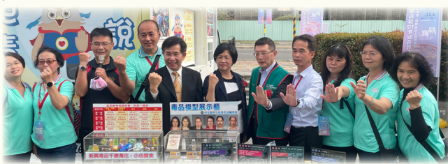
▲ 教育部潘文忠部長與彰化縣王惠美縣長以及中國信託反毒教育基金會王卓鈞副董事長和彰化縣校外會及衛生局同仁合影