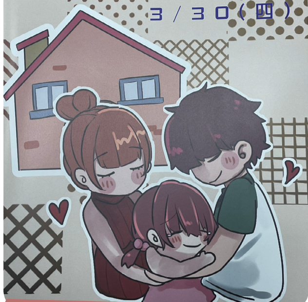
▲ 教育部辦理目睹家暴輔導知能研習