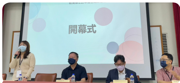
▲ 教育部辦理目睹家暴輔導知能研習開幕式 1