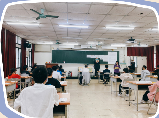
▲ 112 學年度身障甄試已於 3 月 27 日圓滿落幕

考試成績將於 112 年 5 月 2 日（二）上午 10 時公告於甄試網站，網路選填志願時間為 112 年 5 月 30 日（二）上午 9 時至 112 年 6 月 6 日（二）下午 5 時止，統一分發結果於 112 年 6 月 14 日（三）上午 10 時公告於甄試網站。詳細資訊請參閱甄試簡章或至甄試網站查詢。（特教科 林佳怡）