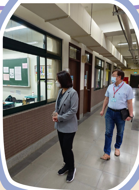
▲ 學務特教司黃蘭琇副司長到場為考生加油打氣