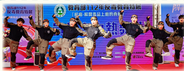
▲ 員林高中熱舞社同學們於開幕表演時展現青春活力及精湛舞技