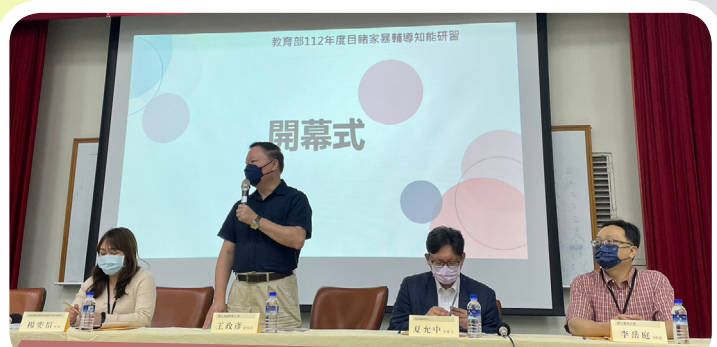
▲ 教育部辦理目睹家暴輔導知能研習開幕式 2