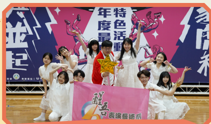
▲ 年度最佳社團特色活動獎 - 醒吾科技大學表演藝術系學會

社團活動能培養學生社會參與的自主能力，並從中習得民主法治的素養與組織領導的才能，期待大專校院學生社團能經由此次評選、觀摩經驗，讓自己獲得新的學習與成長！（學務科 蔡筱如）