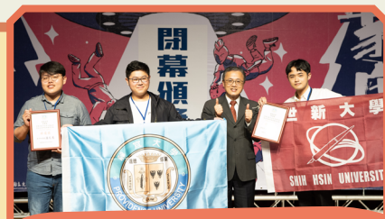
▲ 教育部學務特教司吳林輝司長頒發大專校院康樂性社團特優獎