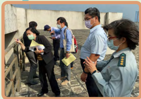
▲ 大同技術學院屋頂訪視