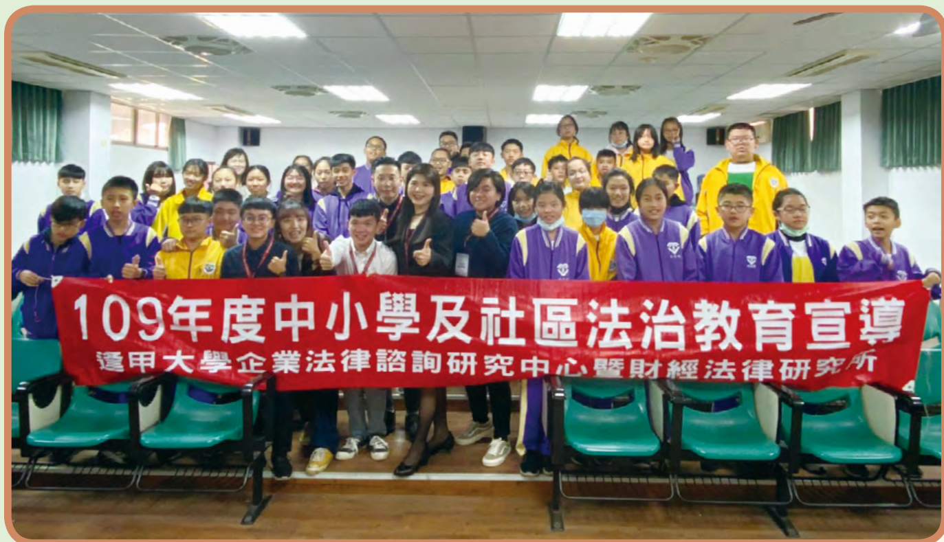
▲逢甲大學至金門縣金湖國中法治教育宣導

「教育部鼓勵大專校院法律系（所）師生推動中小學及社區法治教育，藉由服務、實習增進其生活與服務經驗，幫助中小學學生及社區民眾建置正確法治觀念及資訊。110年度補助23所大學法律系所辦理「中小學及社區法治教育計畫」，其中國立東華大學及臺北教育大學等學校將計畫推展至花蓮、臺東、澎湖及蘭嶼的偏鄉地