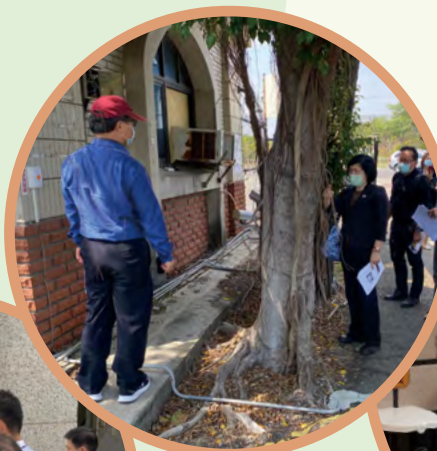
▲ 稻江管理學院停車場訪視