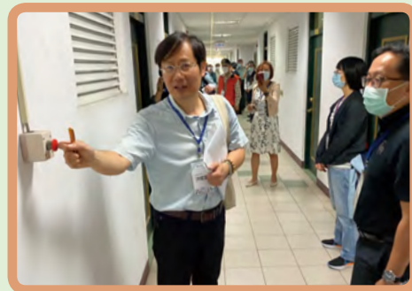
▲ 和春技術學院緊急求救鈴測試

本部為全面強化大專校院校園安全防護措施，由本司於109年11月9日展開160所學校檢視，並針對學生反映安全疑慮之學校展開首波訪視；同時高教司109年12月7日函發「109年度教育部補助大專校院校園安全設備補助須知」，補助學校購置校園安全防護設備並請各校於109年12月15日報部申