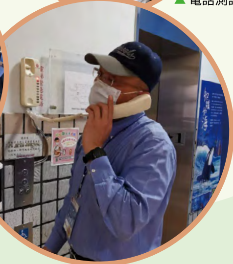
▲ 高雄空中大學電話測試