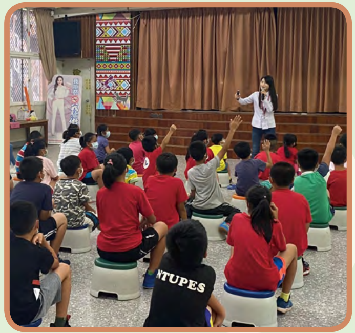
▲ 逢甲大學至苗栗縣東河國小法治教育宣導

講解、座談、討論、法律影片賞析等方式，在寓教於樂的氣氛下，讓法治觀念深植學生與民眾心中。