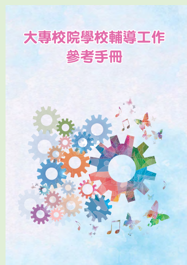
▲ 大專校院學校輔導工作參考手冊封面

的 31 位作者，及 1,241 位參與編修的專家學者與第一線教育輔導工作者的戮力奉獻。輔導是提升教育品質的核心，期待參考手冊能讓更多學生受益，幫助他們身心健康成長，進而提升國家競爭力。（性輔科 林婉雯）