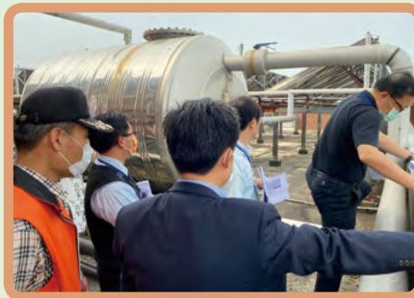
▲ 和春技術學院屋頂防墜訪視