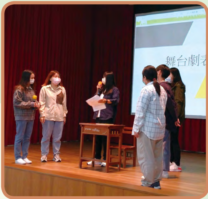
▲ 世新大學至新北市屈尺國小舞臺劇演出