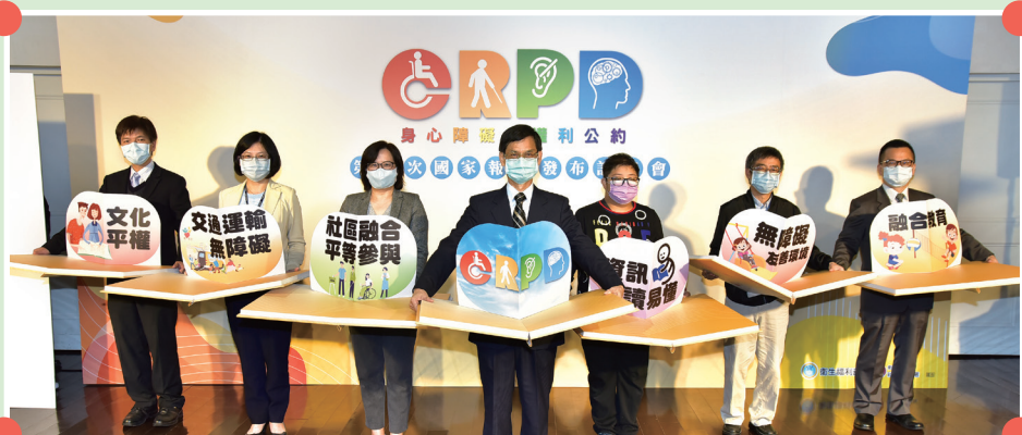
▲ 我國發布 CRPD 第二次國家報告，教育部致力推動融合教育

教育部響應一年一度的國際身心障礙者日，推出 90 秒融合教育動畫影片。融合教育是讓所有學習者、包括身心障礙學生，獲得高品質教育的重要關鍵，也是發展融合、和平和公正社會的重要關鍵。透過影片期使學校師生及家長更進一步認識融合教育，瞭解每一位學生的不同，共同營造最符合所有學生學習需求的環境。