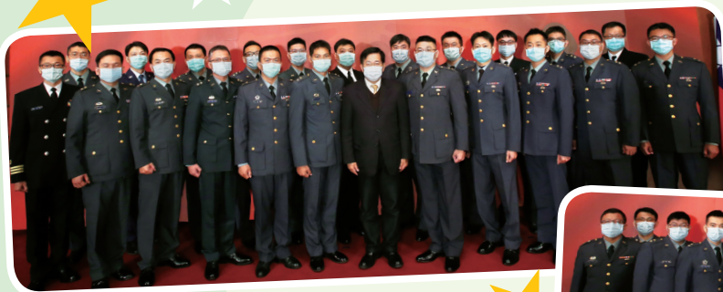
◀ 部長與晉升中校第一梯次軍訓同仁合影