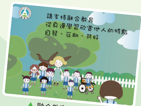
▲ 融合教育圖文懶人包

◀ 教育部融合教育影片連結： https://youtu.be/rs77sjQj1_I