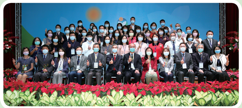
▲ 109年教育部友善校園獎頒獎典禮大合照

營造溫馨和諧、關懷互動、健康安全的校園，認真對待每一個學生，讓孩子們可以在一個優質、尊重與包容的學習環境下快樂適性的成長，一直是教育部推動友善校園學生事務與輔導工作力倡的願景。