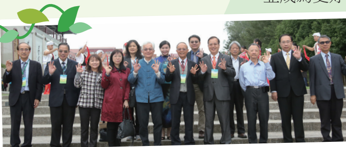
▲ 教育部黃子騰參事與教育部生命教育中心主任林聰明校長及貴賓合照