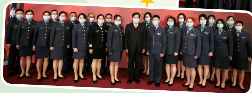
◀ 部長與晉升中校第三梯次軍訓同仁合影