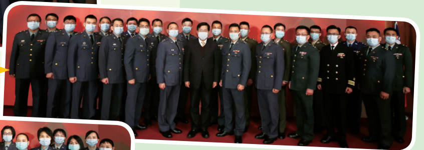
▲ 部長與晉升中校第二梯次軍訓同仁合影