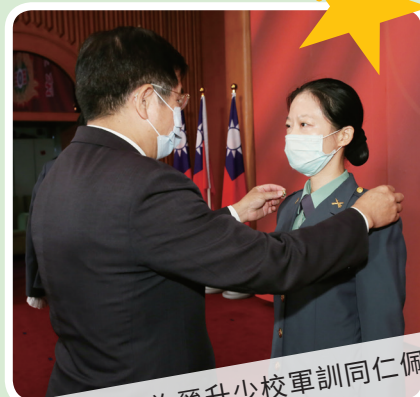
▲部長為晉升少校軍訓同仁佩掛新階級