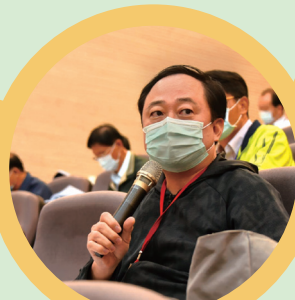
▲ 綜合座談學員發言