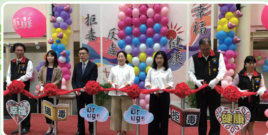
▲ 花蓮徐臻蔚縣長及鄭文瑤專門委員共同開幕剪綵

為表達對於反毒教育的支持，並展現花蓮在地的人文風情，承(協)辦單位也精心規劃參訪動線及服務處，協助防疫並提供反毒宣導禮品。另為推廣本次活動，本部潘文忠部長及花蓮縣徐榛蔚縣長也錄製行銷短片，鼓勵國人能夠踴躍造訪花蓮參觀本次特展，共同為打造無毒健康的幸福家園努力，想了解反毒教育特展更多訊息，歡迎掃描下方官方網站QR Code或加入活動FB粉絲專頁。(校安科 賴竑融)