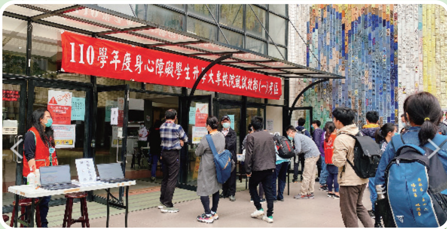
▲ 身心障礙學生升學大專校院甄試北(一)考區

110 學年度身心障礙學生升大專校院甄試 19 日至 22 日分北、中、南、東四區 7 校舉行，報名人數共計 3,210 人；為因應新型冠狀病毒疫情，各考區加強各種防疫措施，確保考生安全。