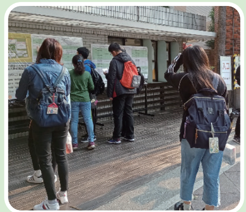
▲ 考生查看應考教室

為使身心障礙學生安心應考，各考場除原先明列固定服務項目外，亦配合個別考生特殊需求，提供適切性考場服務及使用相關輔具。預計 4 月 19 日寄發成績單，4 月 29 日至 5 月 5 日開放考生網路選填志願，5 月 13 日公告統一分發結果。更多考試重要訊息，詳見「110 學年度身心障礙學生升學大專校院甄試招生」網站 https://cis.ncu.edu.tw/EnableSys/home (特教科 周碧惠)