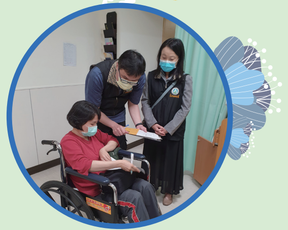
▲ 花蓮縣聯絡處教官赴醫院慰問傷者