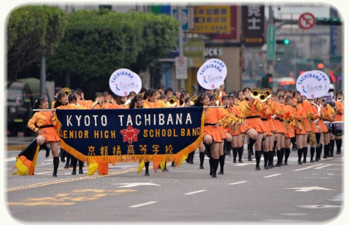
▲ 日本京都橘高等學校吹奏部國慶大會精彩演出

國慶儀典結束後，進入今年的主題表演，主題表演首先以 AH-64D 阿帕契直升機採 5 機編隊衝場作為開場，展現陸航部隊勤訓精練的成果。接著日本京都橘高等學校吹奏部進場，橘高校是全日本吹奏樂聯盟的傳統強校，並屢次獲得金獎；本次演出是近百名學生在吹奏時搭配行進和走位，加入活潑的舞蹈與甜美笑容，邊吹邊跳展現青春朝氣及超高人氣。也是在國慶活動首次邀請外國學生團體共同祝賀國慶，也為台日友好 50 週年留下經典的畫面。活動尾聲由台灣街舞文化推廣協會擔綱演出，其成員係由中部高中生熱舞社及表藝科共 300 位同學所組成，並由總統文化獎得主陳柏均領軍，搭配 18 位台灣街舞「大神」們，用五段音樂組曲、五種服裝背景及五種街舞，區分六大章節表演，傳達臺灣街舞實力從上而下傳承之能量，也