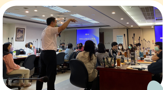
▲ 講師講述邁向網路成癮的七個階段