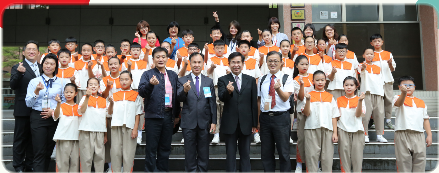
▲ 教育部潘文忠部長及學務特教司吳林輝司長與四鄉五島合唱團合影

中華民國中樞暨各界慶祝 111 年國慶大會暨表演活動於 10 月 10 日上午 08 時 55 分起至 11 時 30 分止，於總統府前重慶南路、凱達格蘭大道及南、北廣場隆重舉行，由國慶籌備委員會主任委員游錫堃先生擔任大會主席。今年國慶以「守土衛國 你我同行」為主題，國慶大會主視覺設計以線性構成方式，表現臺灣多元族群與人民的凝聚力，讓多色的線段向中心匯聚集合，經由色塊交織表現出第二層雙十意象的空間感，並以平面的視覺語彙設計輔助圖形，營造出同行、前進的意象為題，當國際間烏俄戰爭仍持續不斷進行的同時，中共始終未放棄武力犯台，我們更應發揮軍民同心來一同保疆衛土，正因為我們彼此有著相同信念，讓全民防衛力量能夠寓兵於民且廣儲戰力強固整體國防，使得全國同胞萬眾一心來共同為國家的前途發展奮鬥，並且成就穩定且堅實的力量，讓世界能肯定臺灣。序幕暖場的壓軸是北一女樂儀