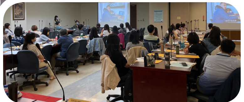
▲ 以微電影帶入案例分析