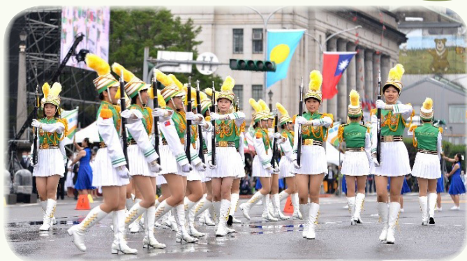
▲ 北一女中樂儀旗隊序幕暖場演出

而國慶大會中的另一亮點，就是穿梭在國慶大會貴賓區亮眼的禮賓人員，他們分別是銘傳大學、中國醫藥大學、國立臺南大學的80位學生擔任。本次獲選禮賓人員的學校，身著特由中華文化總會推薦知名設計師周裕穎設計禮賓人員服裝，周裕穎設計師特別以