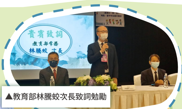
▲教育部林騰蛟次長致詞勉勵

隨著國際上對融合教育及輔助科技應用的重視，如何協助特殊教育學生順利在一般教育環境中學習已成為各國特殊教育發展重點，教育部期望藉由本次研討會交流國內外特殊教育相關經驗，並透過政府與民間攜手合作，共同提升我國特殊教育的品質。（特教科 鄭浩宇）