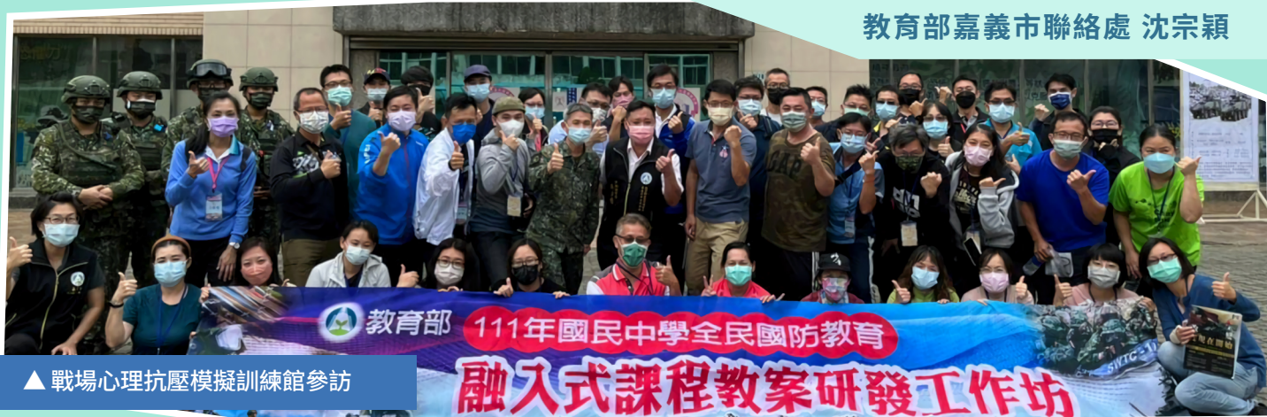
▲ 戰場心理抗壓模擬訓練館參訪

教育部為落實全民國防教育向下扎根，並推展全民國防教育融入式教學，於 111 年 10 月 24 日至 10 月 25 日辦理 2 天 1 夜「教育部 111 年度國民中學全民國防教育融入式課程教案研發工作坊」，邀請全國各縣市國民中學教師參加，期盼藉由工作坊讓教師們瞭解現階段全民國防教育政策、意涵、及融入式教學目的與方式，並鼓勵教師們結合在地歷史文化，發展具別具特色的全民國防教育融入式課程。