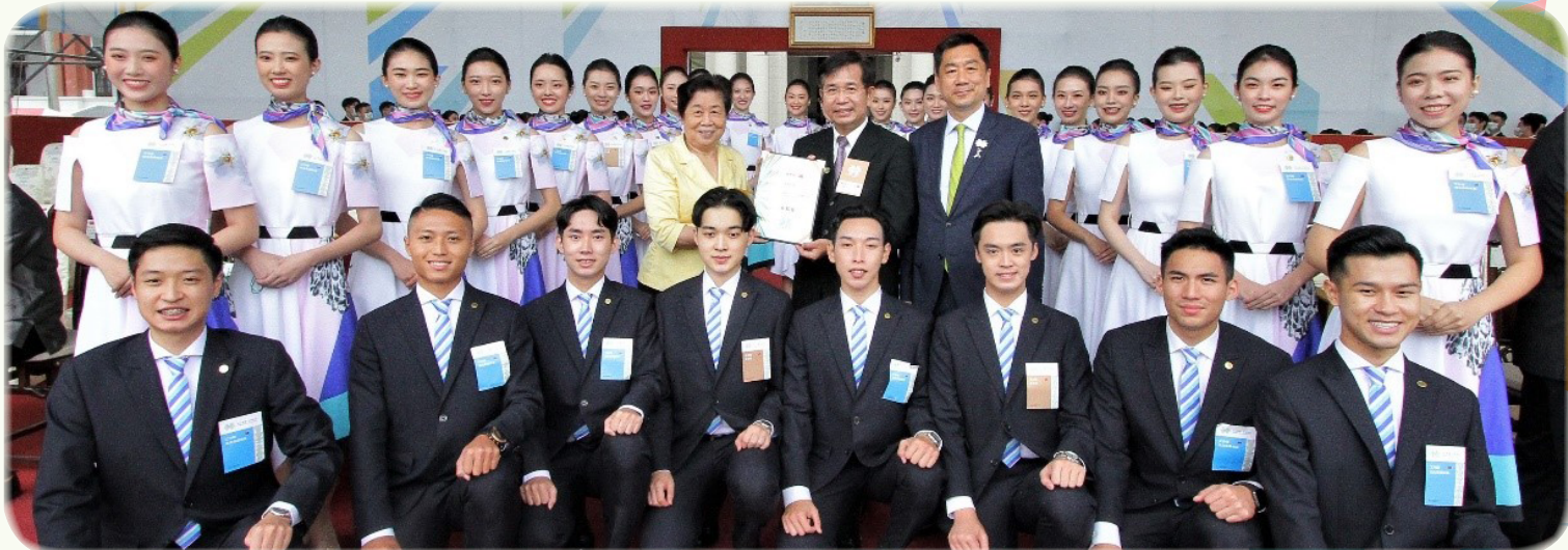
▲ 教育部潘文忠部長與禮賓學生合影

近兩個月的籌備期間，大會處每位同仁均齊心協力，充分發揮團隊合作精神，從進駐到國慶大會舉辦，多次協調會議，驗收與預演編排，都能秉持著堅定不移的信念，努力克服重重關卡，並圓滿達成任務。（國防科黃泰翔）