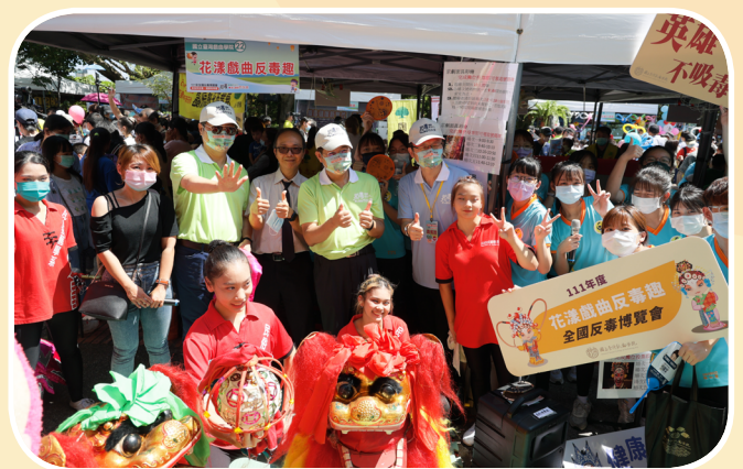
▲ 行政院羅秉成政務委員及教育部潘文忠部長攤位互動體驗

羅秉成政務委員則表示，推動反毒工作向來是政府刻不容緩的重要施政事項，新世代反毒策略2.0實施後，行政院依「三減策略」，從「減少供給」、「減少需求」及「減少傷害」3方面著手，在「減少供給」第一戰線成立了安居緝毒專案，統合檢、警、調、憲兵、海巡、海關等六大緝毒系統的力量，共同面對打擊毒品這場長期抗戰，第二戰線「減少需求」最難，需要靠宣導，今天辦理這個大會就是要讓大家減少需求，最後減少傷害。