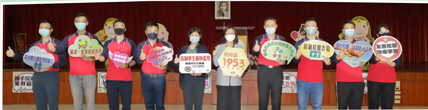
▲教育部學務特教司黃蘭琇副司長與辦班幹部合影

為培育優質校園安全之學務(含校安)人力,教育部於111年10月17日(星期一)在國家教育研究院三峽總院區實施「111年第2梯次高級中等以上學校學務(含校安)儲備人員培訓」開訓典禮,開訓典禮由教育部學生事務及特殊教育司黃蘭琇副司長主持。本梯次計有181位的學員參訓,在執行官臺中市政府教育局董勝安督導帶領的辦班團隊規劃,全體學員在愉悅、和諧的氣氛中展開為期二週的培訓課程。黃副司長首先歡迎來自全國各地學員參與本次研習,並特別感謝國家教育研究院提供舒適及優美的環境。