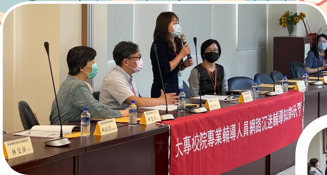
▲ 大專校院專業輔導人員網路沉迷輔導知能研習開幕致詞

教育部期待透過本次研習，提升專業輔導人員辨識個案的敏銳度與強化大專校院專業輔導人員的輔導知能。鼓勵學校善用網路習慣使用量表，作為初步篩選與了解個案的評估依據之一，及早介入給予輔導，並運用多元輔導策略來因應網路成癮事件，幫助學生平衡現實生活與虛擬生活。（學生輔導科 柯鈺萱）