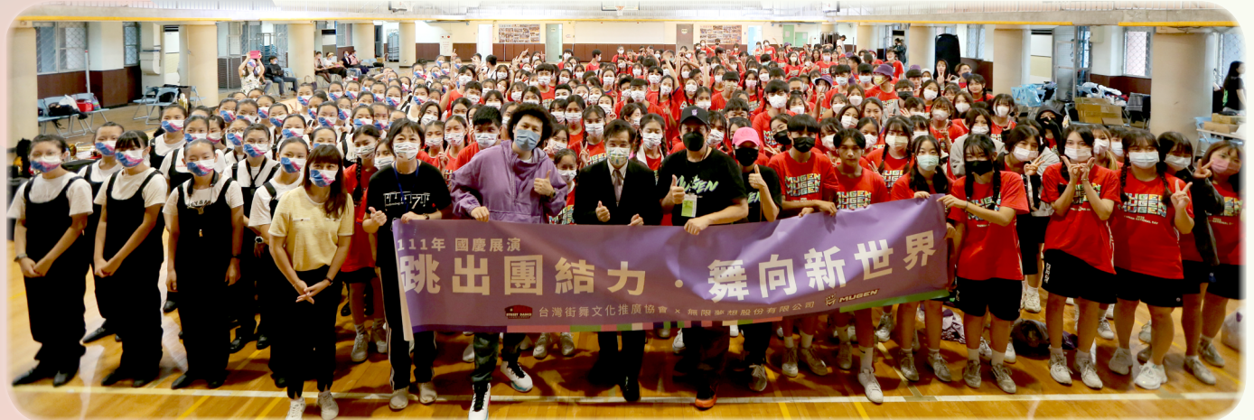
▲ 教育部潘文忠部長與台中街舞協會學生合影

國慶儀典結束後，進入今年的主題表演，主題表演首先以 AH-64D 阿帕契直升機採 5 機編隊衝場作為開場，展現陸航部隊勤訓精練的成果。接著日本京都橘高等學校吹奏部進場，橘高校是全日本吹奏樂聯盟的傳統強校，並屢次獲得金獎；本次演出是近百名學生在吹奏時搭配行進和走位，加入活潑的舞蹈與甜美笑容，邊吹邊跳展現青春朝氣及超高人氣。也是在國慶活動首次邀請外國學生團體共同祝賀國慶，也為台日友好 50 週年留下經典的畫面。活動尾聲由台灣街舞文化推廣協會擔綱演出，其成員係由中部高中生熱舞社及表藝科共 300 位同學所組成，並由總統文化獎得主陳柏均領軍，搭配 18 位台灣街舞「大神」們，用五段音樂組曲、五種服裝背景及五種街舞，區分六大章節表演，傳達臺灣街舞實力從上而下傳承之能量，也