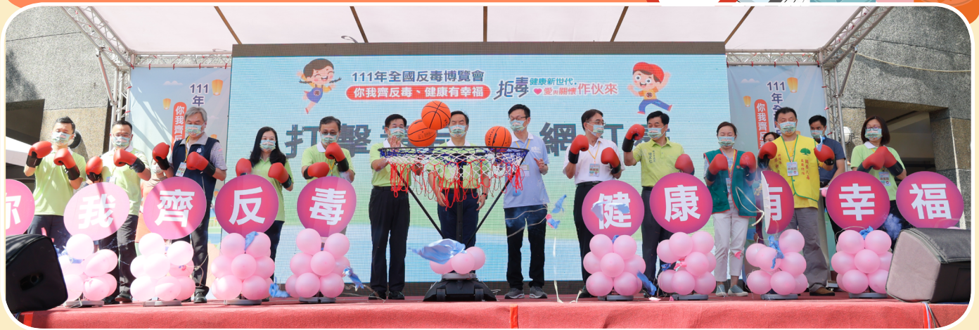
▲ 反毒博覽會開幕儀式

為展現中央、地方政府及民間共同推動「新世代反毒策略」的成果，教育部結合新北市政府，於10月1日（星期六）在新北市新莊體育園區及體育館，盛大舉辦全國反毒活動。活動邀請行政院政務委員兼發言人羅秉成、教育部長潘文忠、新北市教育局長張明文出席致詞，與全國各縣市國小反毒領航員共同參與拒絕毒品的宣示，並進行「反毒績優單位頒獎」，表彰全年度戮力執行反毒工作的教育行政機關及學校。