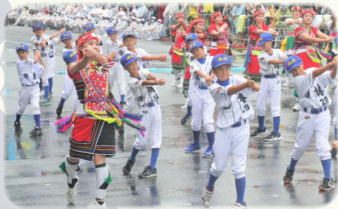
▲ LLB 少棒季軍 - 福林國小少棒隊國慶大會精彩演出

今年國慶禮讚由國立實驗合唱團首次搭配國軍示範樂隊，帶來重新詮釋，表演時間近七分鐘的名曲「大家行共路」，以輕快的鼓聲開場，接續由代表中華民國 111 年的 111 位團員以純淨清朗的美聲演唱，展現其極具團結向力的音樂，同時象徵臺灣這塊土地上的人民，能夠不分彼此，齊心團結，共同面對各項挑戰。