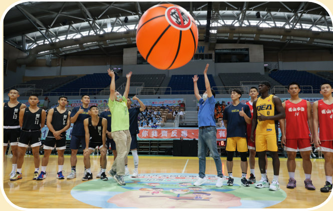
▲ 籃球反毒開球儀式

隨後由中山國小學生代表全體反毒領航員進行宣誓與授證儀式，與會嘉賓戴上拳擊手套、共同做出打擊毒品的動作後，本次反毒博覽會正式展開。第一站「千人舞健康」活動，由行政院及各部會參與長官攜手與超過千名學生在主舞台前戶外陽光草坪排出愛心圖樣，在炙熱的陽光下，共同舞出反毒健康操，盡情展現青春熱情活力。第二站次舞台前方，有來自中央部會、各縣市、大專院校及民間團體等共同設置 77 個創意反毒闖關攤位，設計多樣創意闖關趣味活動，包括財