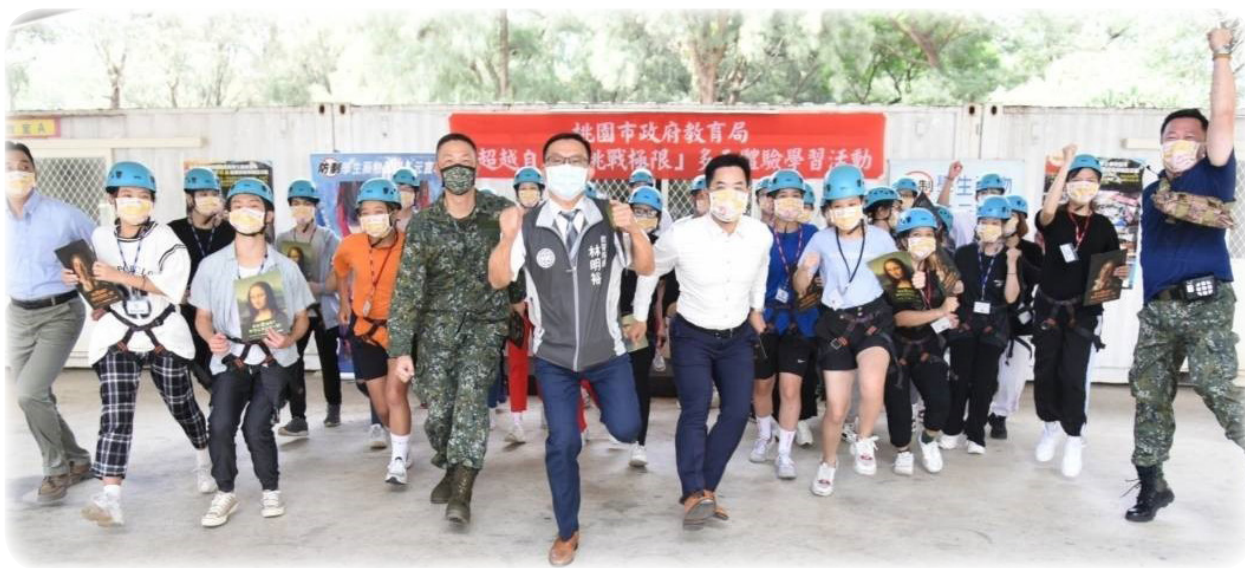
▲ 林局長與參加同學們開心合影

為了讓桃園市青少年學子能在暑假期間充分展現活力自我、迎向無毒人生，桃園市政府教育局特別突破傳統反毒宣導之模式，改以時下年輕學子最喜愛之極限體能王項目融入反毒宣導，並首次與青年局合作，在「桃園青年體驗園區 (TYAC)」擴大辦理 2 天 1 夜的青少年反毒極限挑戰活動，本市各高中職學生報名踴躍，此次活動將反毒教育結合體能訓練，一方面提倡學生暑假期間正當休閒活動，也利用此體能探索體驗活動，激發學生之冒險、挑戰與團隊精神，強化學習動機、進而培養其自信心，同時亦透過專業師資帶領，引導學員們自我察覺與過程反思，幫助其瞭解自身能力