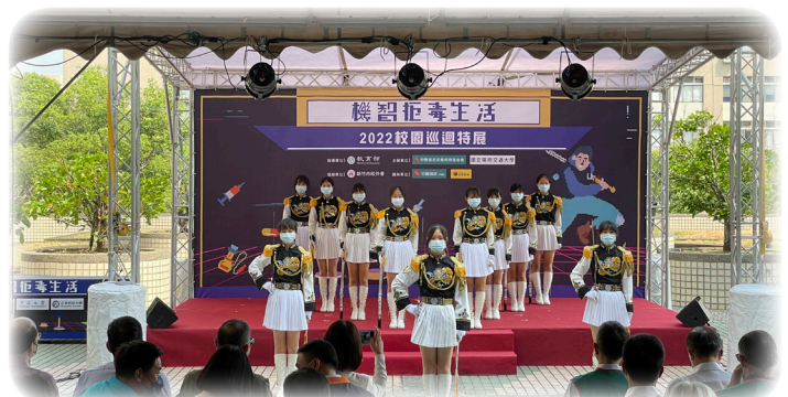
▲ 開幕記者會活動由國立新竹女子高級中學沂風儀隊表演揭開序幕