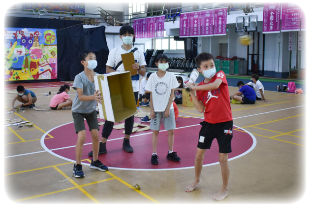
▲ 國立臺灣科技大學嚕啦啦康輔社帶領樹屋小隊學員表演打棒球活動會前練習

大專學生社團結合自身專門領域，融入生命、品德、人權及法治教育、性別平等、社區服務、資訊輔導、識毒宣導、美感教育及多元文化等營隊主題，規劃富有教育意涵的活動內容，讓參與的大專校院學生志工能在過程中培養社會所需的多元能力，同時提升教育優先區中小學生的課外活動資源，讓學生社團活動的教育功能得以更充分地發展。(學務科 蔡筱如)