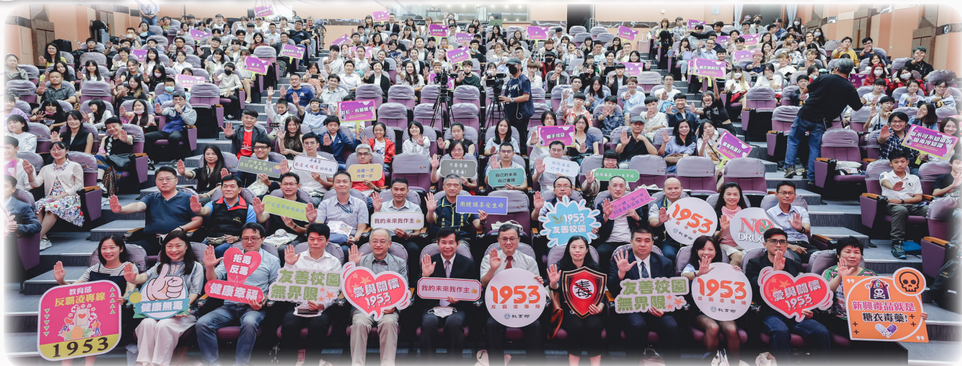
▲微電影頒獎典禮大合影