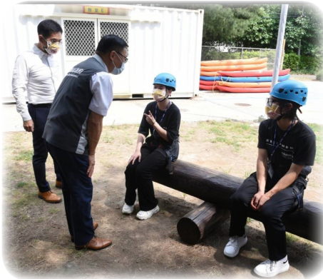
▲ 林局長親切與同學訪談