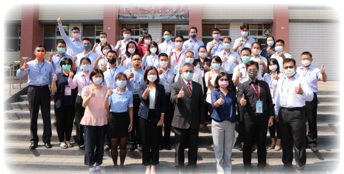
▲教育部學務特教司吳林輝司長與國慶籌備會工作同仁合影

最後，司長也再次感謝所有同仁在守護校園之際，還能對籌備工作盡心盡力，並祝福大家身體健康，籌備工作圓滿成功。