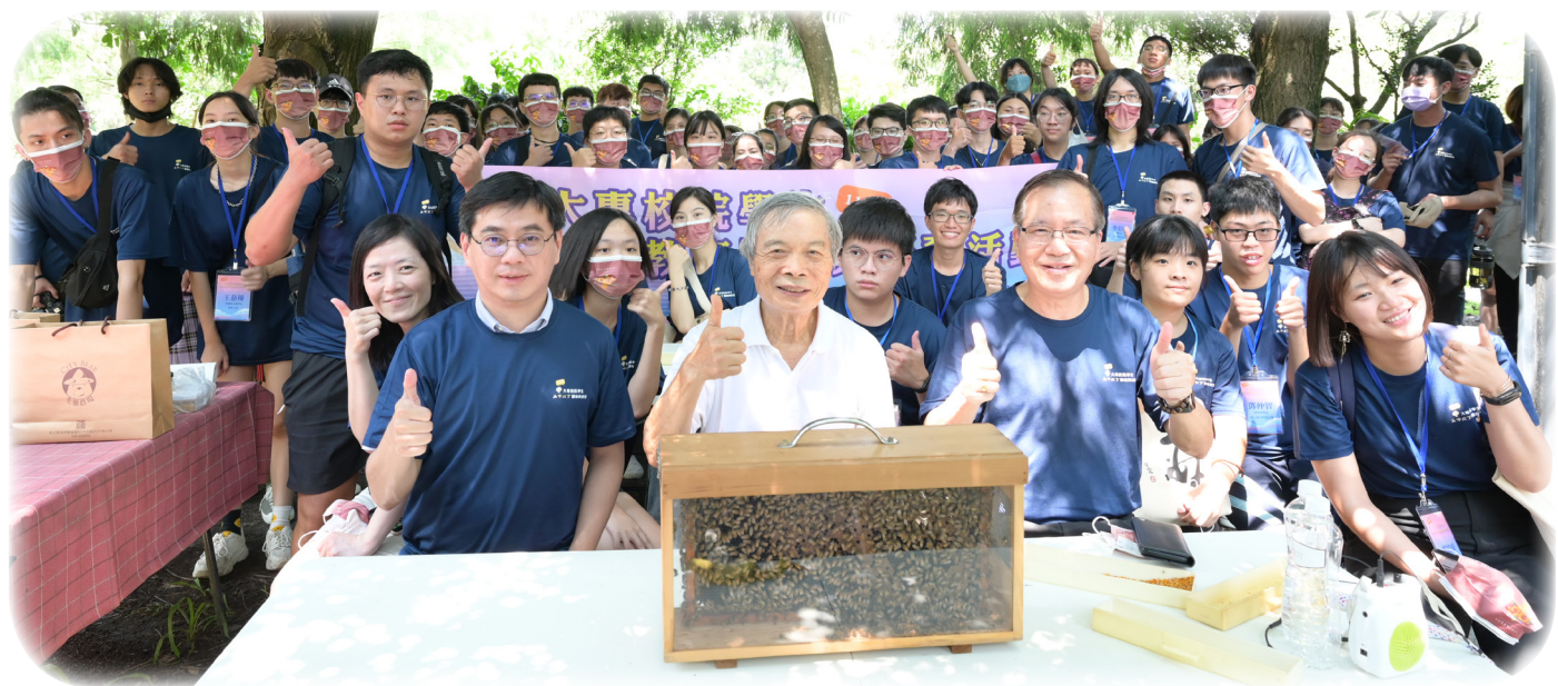
▲在地體驗與學習（一）- 生命教育與環境永續學習體驗（City Bear 生態農場）

教育部表示，期待未來在「教育部生命教育推動方案」的帶動下，配合「大專校院辦理生命教育校園文化推廣與深耕計畫」與「大專校院辦理生命教育教學社群與課程發展實施計畫」，結合在地特色並深耕校園生命教育文化，讓生命教育透過傳承、資源與經驗共享，用愛與希望陪伴著孩子成長，讓孩子在校園中快樂學習並成為更好的自己。（學生輔導科 何依娜）