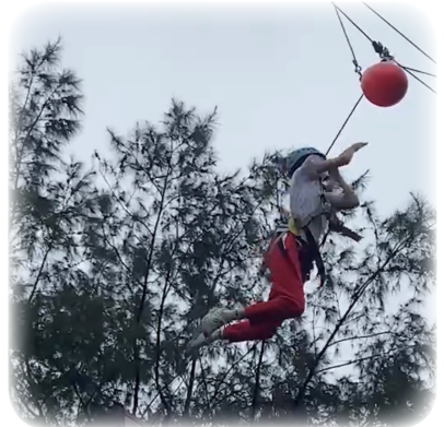
▲ 挑戰高空擊球克服恐懼及自我實現