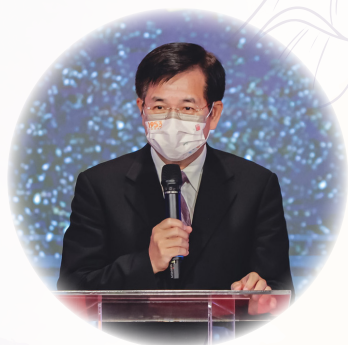
▲教育部長潘文忠致詞

教育部第五屆「我的未來我作主」微電影競賽頒獎典禮，9月17日於臺北市青少年發展處6樓國際會議廳舉行，現場揭曉「防制毒品」、「防制霸