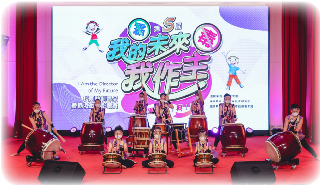
▲坪林國小精彩的開場表演