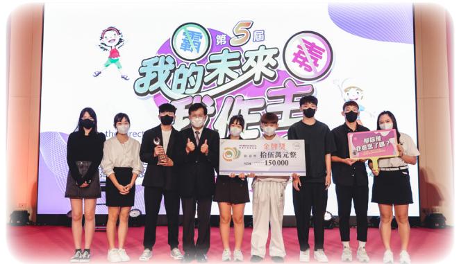
▲高級中等學生組 - 防制毒品金牌《那你懂我意思了嗎？》