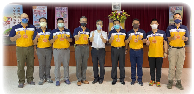
▲教育部學務特教司吳林輝司長與辦班幹部合影

司長期勉學員於兩週的研習，能從豐富多元的課程有所收穫，未來投入校園安全及學生輔導與服務時，能學以致用並發揮更多創新作法，期許全體學員能提升自我的敏銳度及新知，即時體察學生、同僚以及環境的變化，成為學生傾聽者、資源整合者及家長信任者，積極查察、主動協處，進而預防意外及突發事件的發生，營造健康、安全、溫馨的友善校園。最後，司長期盼在座的每一位學員，無論是服務在學校的現職教官、校安人員或未來要擔任其他學務工作的人員，也都能莫忘初衷、秉持工作熱忱，以利日後為校園及莘莘學子提供優質服務，為每位孩子找到屬於自己的天空。