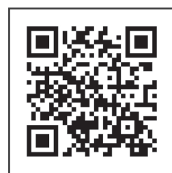
▲ 春暉小組輔導工作手冊 2.0 QR CODE