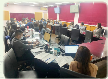
▲ 特教專家學者與教師團體及民間代表參與座談會

融合教育是一個連續的改革進程，而在十二年國教課綱也是推動融合的思維，所有學生包括身心障礙學生，均使用相同之課綱，並為有特殊需求學生擬定「十二年國民基本教育特殊教育課程實施規範」，及訂各種特殊需求領域課程綱要，如社會技巧、溝通訓練、定向行動、輔助科技應用等。因此，辦完 6 場 CRPD 融合教育焦點座談會並不代表結束，教育部表示會再整理歸納座談會的意見，將其納入國家融合教育計畫之重要參考依據，對於有共識、近期可執行的建議，將儘快予以推動，對於需要深入探討、不同觀點之意見，也將列為日後繼續探討之議題。（特教科 陳清風）