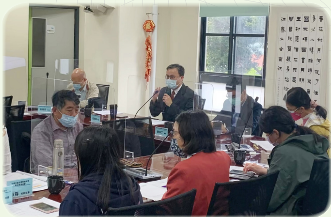
▲ 教育部學務特教司司長吳林輝向與會者說明我國目前推動融合教育情形

臺灣實施特殊教育跟隨國際脈動趨勢，將融合的思潮引進國內並推動融合教育十多年，特殊教育法強調學生適性發展，配套訂定相關法規提供各種調整措施，以保障特教學生的受教權。教育部為使我國融合教育朝向身心障礙者權利公約（CRPD）所訂的平等、不歧視、尊重差異、機會均等及充分有效參與及融合社會等目標邁進，經初步盤點融合教育推動現況，先歸類出鑑定安置原則調整、特教學校轉型、增進特教班與普通班之融合、普特教師合作、學校整體支持及專業提升、校外特教資源導入等 6 項議題，在 3 月至 5 月期間於臺北市聽障教育資源中心，針對各議題辦理 6 場次「2022 推展 CRPD 融合教育相關議題焦點座談會」。