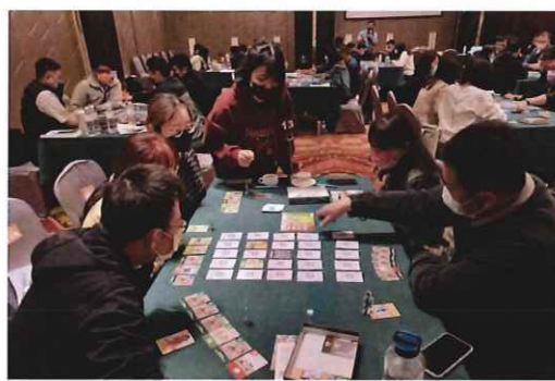
▲ 各組熱烈討論桌遊玩法

為了推廣「救災決策 60 秒」創作桌遊，教育部與臺中市政府教育局攜手合作，於 4 月 7 日及 8 日在清新溫泉飯店舉辦中部地區為期 2 場次「防衛動員與災害防救」課程增能暨創作桌遊推廣巡迴工作坊師資培訓，共計 160 位學員，分別來自桃竹苗、中彰投等縣市高中職擔任全民國防教育必修課程教學人員參加。期望透過師資增能培訓的方式，讓防衛動員與災害防救的正確救災觀念種子於學生心中萌芽。