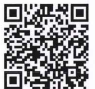
▲ 藥物濫用 LINE@