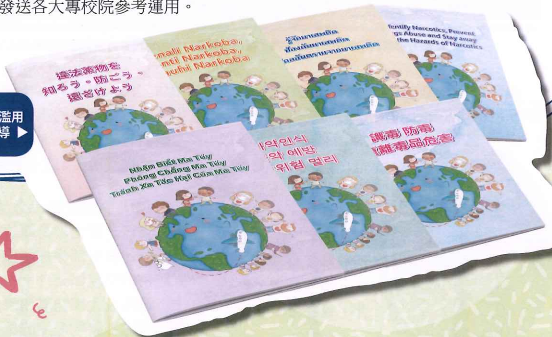
外語藥物濫用 防制宣導

本手冊電子檔可至本部防制學生藥物濫用資源網 / 最新消息下載 ( https://enc.moe.edu.tw/ )。(校安科 林筱青)