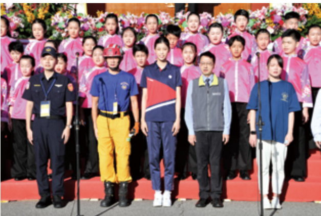
▲國立客家兒童合唱團與英雄代表