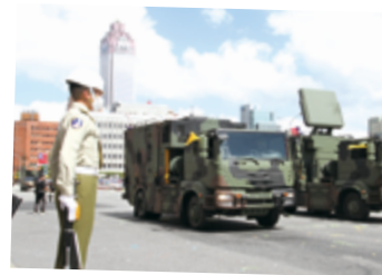
▲ 守土有責當仁不讓

契與 AH-1W 眼鏡蛇直升機伴隨下，緩緩通過總統府前廣場上空，以凌空飄揚的國旗，為國家慶典增輝，展現鼓舞軍民士氣及凝聚向心的目的。