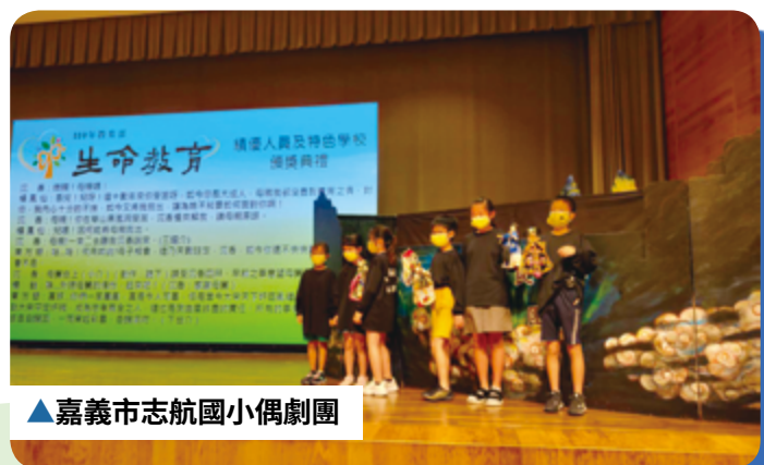
▲嘉義市志航國小偶劇團