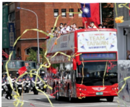
▲ 東京奧軍、帕軍英雄車隊 1