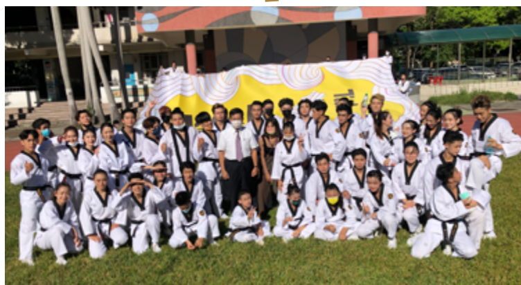
▲ 潘文忠部長與 We.R 特技跆拳道表演團合影