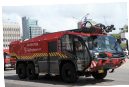
▲ 安定社會非我莫屬 - 消防