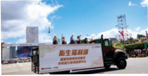
▲國土純淨捨我其誰 - 衛福部