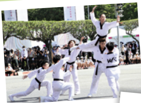
▲ We.R 特技跆拳道表演團 - 團結與希望