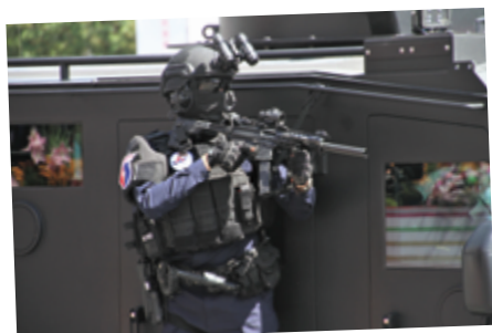
▲ 安定社會非我莫屬 - 警政

國慶儀典結束後，進入今年的主題遊行表演，首先由體育署安排的東奧英雄車隊擔任開場，接續為「捍衛臺灣」主題展演，區分三個梯隊，第一梯隊主題為「安定社會 - 非我莫屬」，由空勤總隊旋翼機領隊，率警政、