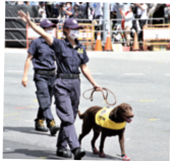
▲國土純淨捨我其誰 - 法務部