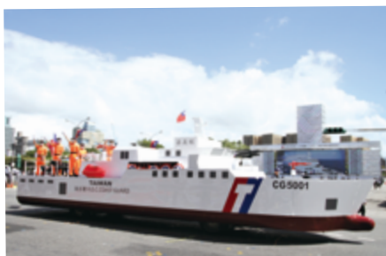
▲ 安定社會非我莫屬 - 海巡