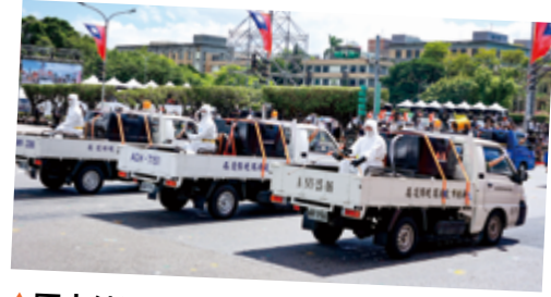
▲國土純淨捨我其誰 - 環保署

消防、海巡車隊進場；第二梯隊主題為「守土有責 - 當仁不讓」，由國防部空中兵力搭配地面裝備，展現我堅實國防力量；第三梯隊主題是「國土純淨 - 捨我其誰」，則由衛福、經濟、法務、財政、交通、環保、科技、農業等機關部會代表共同參演。最後，由空軍雷虎小組 AT-3 教練機編隊以大雁隊形，飛越通過觀禮台做扇形展開，為國慶大會劃下完美的句點。