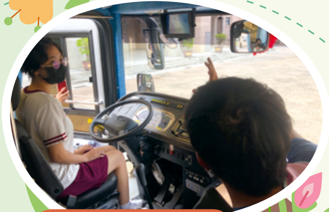
▲大客車開進嘉女校園 宣導視野死角及內輪差危險