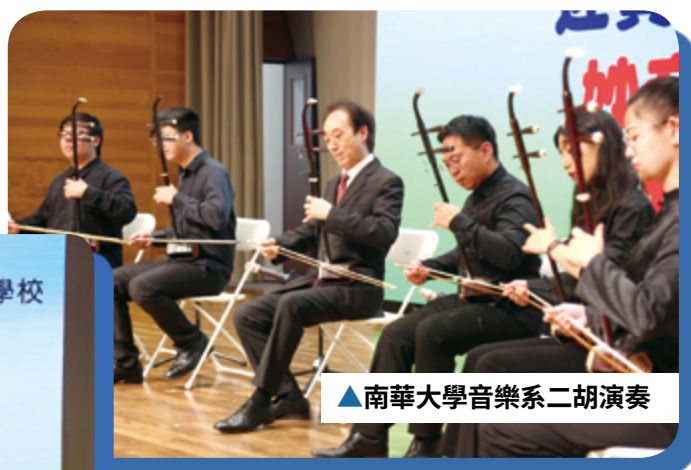
▲南華大學音樂系二胡演奏