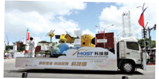
▲國土純淨捨我其誰 - 科技部