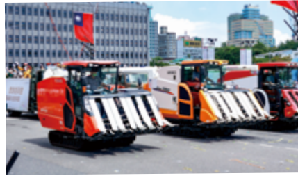
▲國土純淨捨我其誰 - 農委會