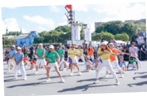
▲ TBC 舞團表演 - 世代融和街舞賀國慶