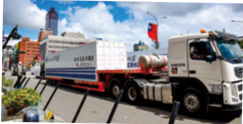
▲國土純淨捨我其誰 - 經濟部

而國慶大會中的另一亮點，就是穿梭在國慶大會貴賓區亮眼的禮賓人員，他們分別是銘傳大學、國立臺北大學、中國醫藥大學及國立臺北教育大學的 80 位學生擔任。這 4 所大學在歷年禮賓接待工作表現上均獲各界好評。他們專業的服務、清新的形象，搭配精心設計的禮賓人員服裝，即使戴上國慶版防疫口罩，還是帶著親切笑意的眼神，都共同祝福我們國家「生日快樂」!(國防科 黃泰翔)