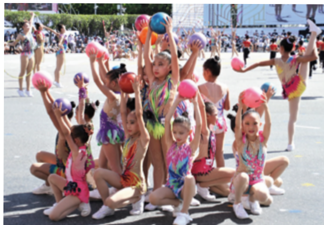
▲ 中華民國體操協會表演 - 璀璨青春，我們的主場

中華民國中樞暨各界慶祝 110 年國慶大會暨表演活動於 10 月 10 日上午 08 時 55 分起至 11 時 30 分止，於總統府前重慶南路、凱達格蘭大道及南、北廣場隆重舉行，由國慶籌備委員會主任委員游錫堃先生擔任大會主席。今年國慶以「2021 民主大聯盟 世界加好友」為主題，本次國慶大會視覺設計以「交織的繩線」為題，當國家在面對國際間各種挑戰及難關時，除國內同胞同心齊力團結合作，也因有著共同信念、目標的民主陣營盟友，馳援守望、互相扶持，讓彼此間的友誼交織團結一起，成就一股堅定的力量，讓臺灣在世界上站穩腳步。