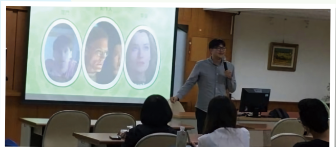
▲國立中山大學專題講座 - 心理師陪你聊電影《楚門的世界》