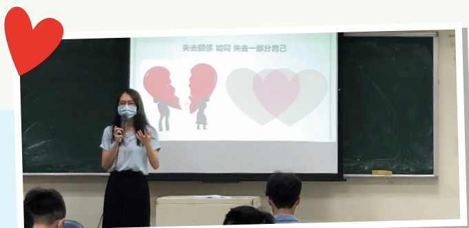
▲中華科技大學專題講座 - 學習好好說再見—分手調適

未來教育部仍將持續與大專校院協力落實情感教育，從課程教學、學生活動、宣導推廣、教師增能等面向扎實推動，讓學生能在大專校院教育階段完成情感教育這一門人生的必修學分。(性輔科 邱玉誠)