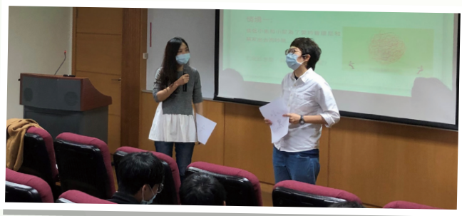
▲中華科技大學專題講座 - 關係中的衝突與溝通