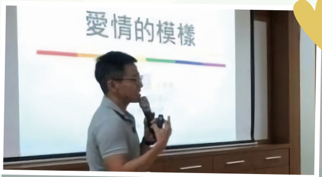
▲國立中山大學專題演講：愛情的模樣