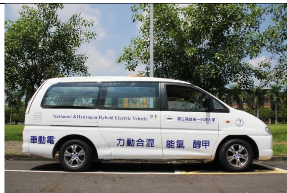
第一科大研發之亞洲第一台「甲醇氫能電動車」