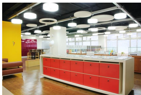
第一科大「創夢工場」提供創客實作的空間與設備