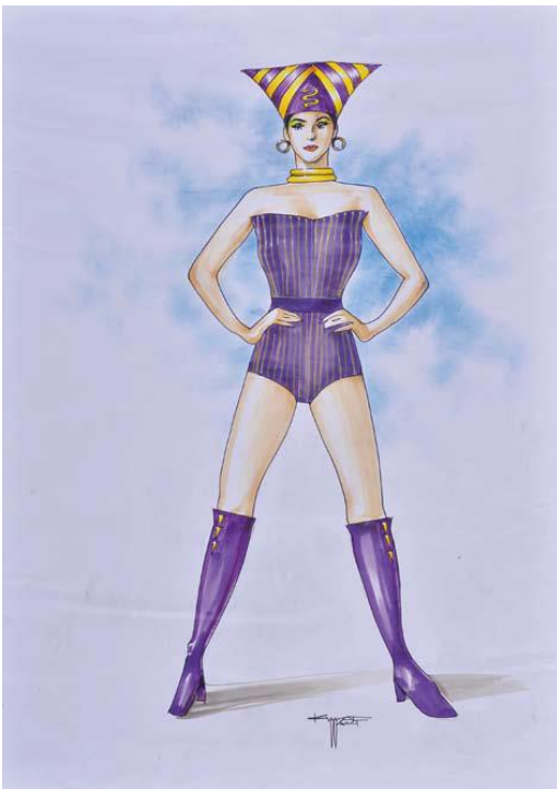
王健 舞臺裝 83x58cm

以麥克筆特有之工具性，繪出建物鳥瞰之場景（三點透視），綜合各類畫材型塑不同材質之表現。