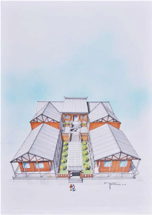
王健 沙鹿民宿旅店 83x58cm

以麥克筆特有之工具性，繪出建物鳥瞰之場景（三點透視），綜合各類畫材型塑不同材質之表現。