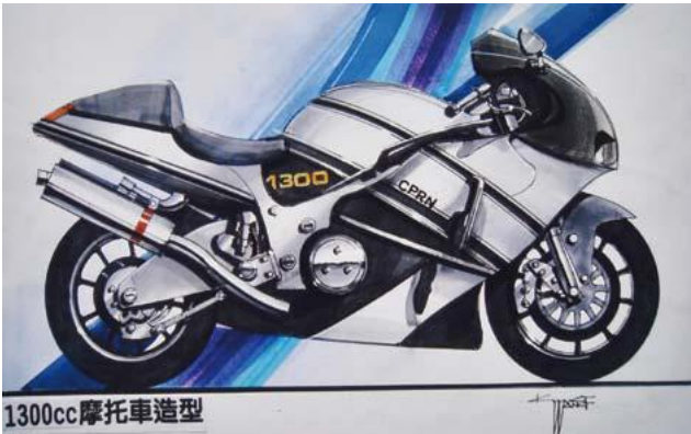
王健 保時捷&1300cc機車 64x45cm

利用麥克筆之透明性與包容性，以寬筆打底，以粉彩染色，再以溶劑渲染背景，再以廣告顏色點出亮點，用多元方法呈現。