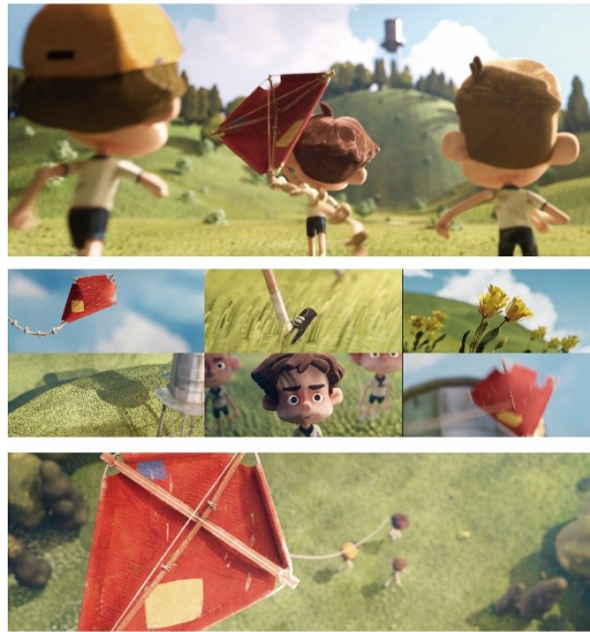
THE WINDY DAY - Opening Animated Short Film Opening

THE WINDY DAY Directed by XU SHI QIAN & XIE ZONG YI