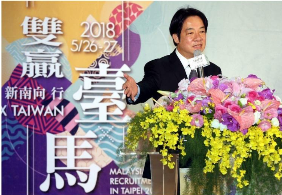
行政院長賴清德上午出席馬來西亞僑台商攬才博覽會開幕，對新南政策再次提出利多。

70 個馬來西亞僑台商參展 1,280 個專業職缺 1,000 名馬來西亞僑外生及臺生參加