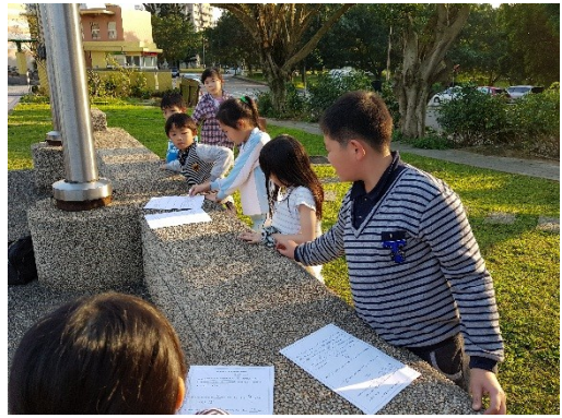
桃園市龜山區長庚國民小學教師教學策略多元，於司領臺進行長度測驗