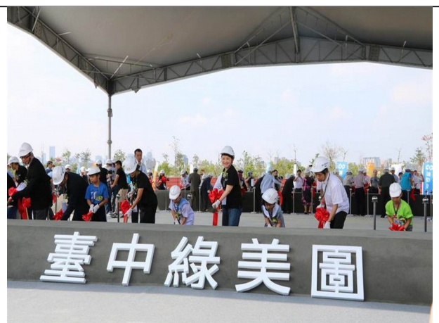
臺中市立圖書館刻正興建「綠美圖」新總館，全力投入圖書館建設準備，帶動市內閱讀力發展