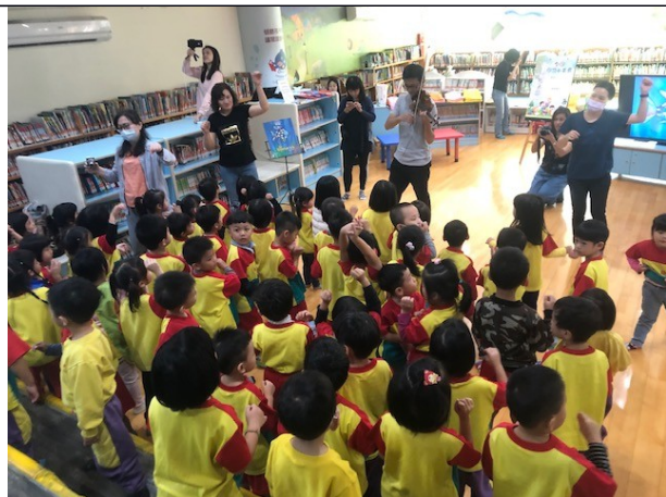
臺東縣提升服務品質與建立專業形象，吸引使用人潮