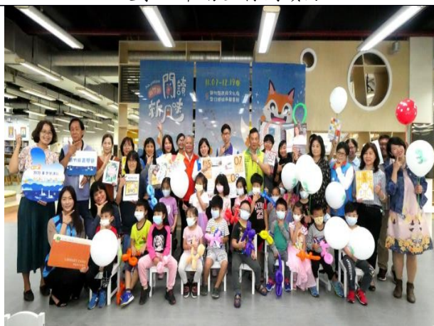
新竹縣響應臺灣閱讀節，攜手 14 鄉鎮圖書館推動閱讀，帶動閱讀熱力