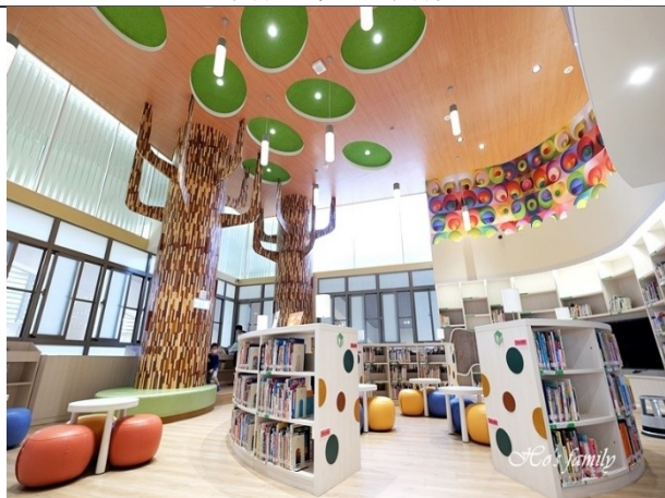
桃園市多間圖書分館新落成，配合服務時間延長等政策，帶動全市閱讀力躍升