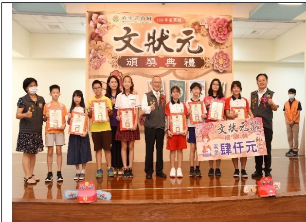
苗栗縣以文會友，辦理文狀元選拔，推動閱讀與文學，帶動全縣閱讀力