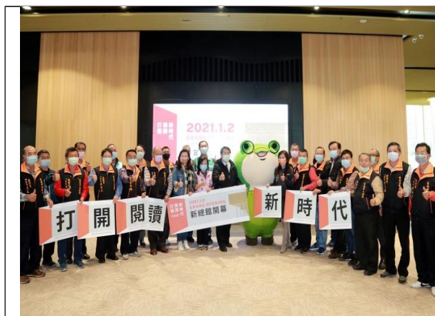
臺南市立圖書館新總館開幕，市府全力支持推動圖書館事業，閱讀力表現績優

註：民眾持證比例表現取持證比例大於 50% 者，直轄市有 6，縣市有 7，鄉鎮市有 10。