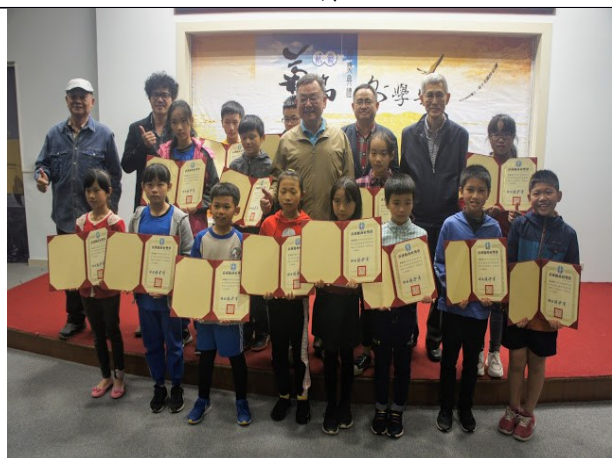
澎湖縣融合本土自然景觀和人文推動菊島文學，促進閱讀力發展