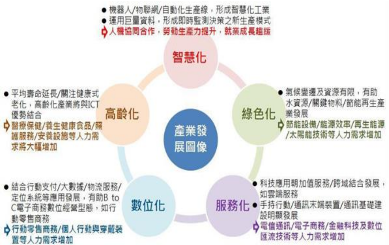
圖 1：產業與人力需求發展圖像

資料來源：國家發展委員會/產業人力供需資訊網/未來 10 年整體就業人力推估 ( http://theme.ndc.gov.tw/manpower/Content_List.aspx?n=B615E37678E4E021 )