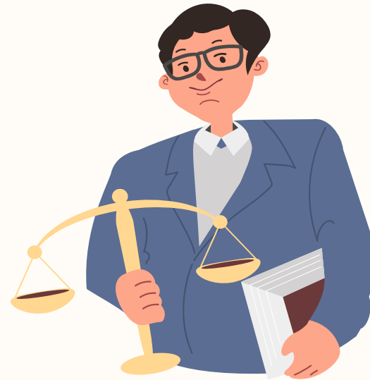
專家諮詢/資源整合