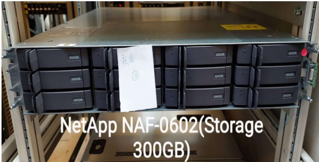
NetApp NAF-0602(Storage 300GB)