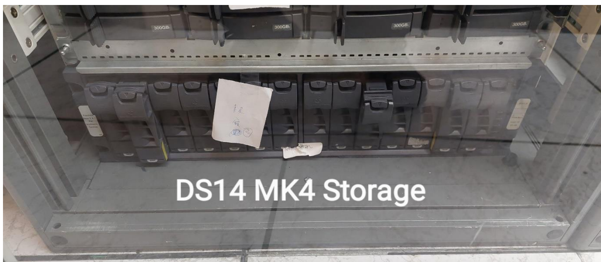
DS14 MK4 Storage (NETAPP 備機)