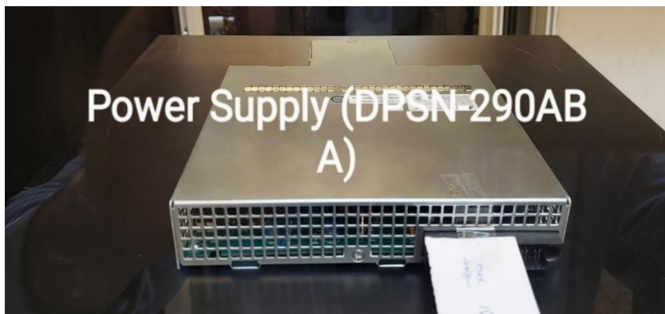
L7 Networks InstantCheck-5000J