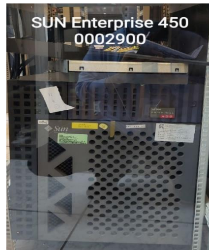
SUN Enterprise 450