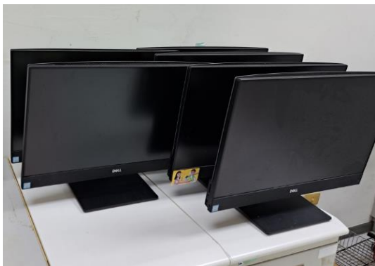
個人電腦-一體機(25臺)