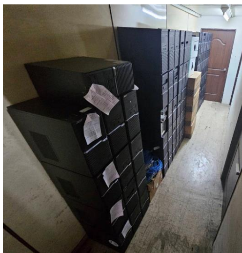
主機(無硬碟、記憶體、螢幕)(1批)