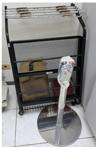
廢鐵-報架、底坐等(1批)