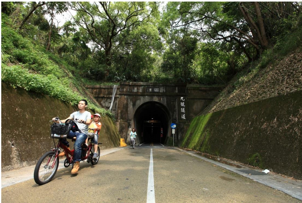
十大自行車經典 路線—臺中東豐 自行車道綠廊— 后豐鐵馬道