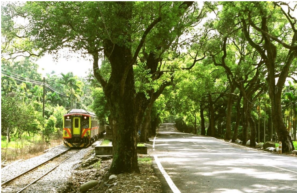
十大自行車經典 路線－南投集集 綠色隧道暨環鎮 自行車道