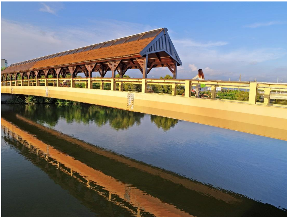
十大自行車經典 路線－屏東大鵬 灣環灣自行車道