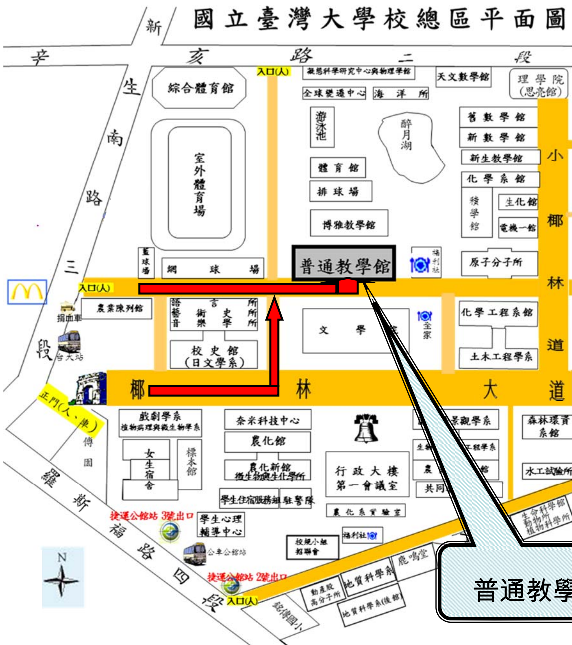
【臺灣大學普通教學館】試場分配圖第 1~14 試場