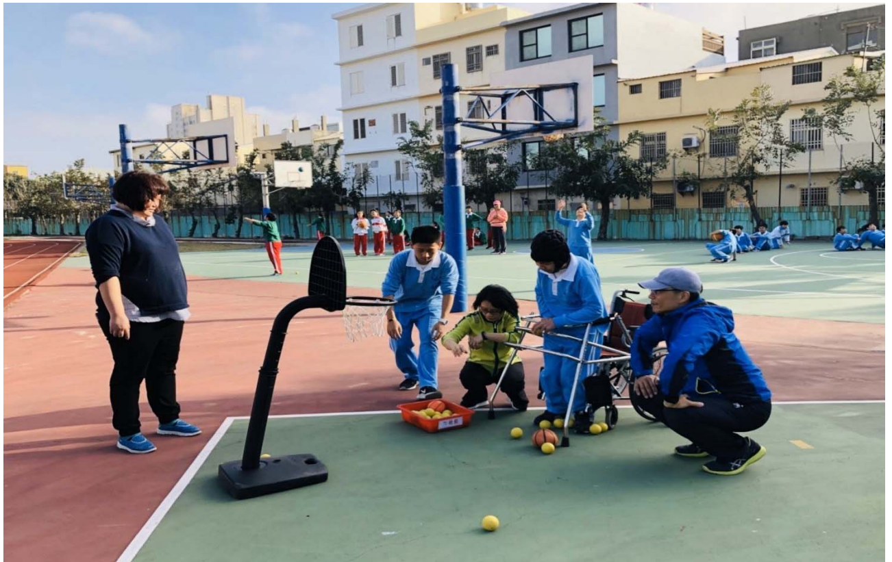
臺中市順天國中推展學校適應體育 (上圖) 高雄市五權國小推展學校適應體育 (下圖)