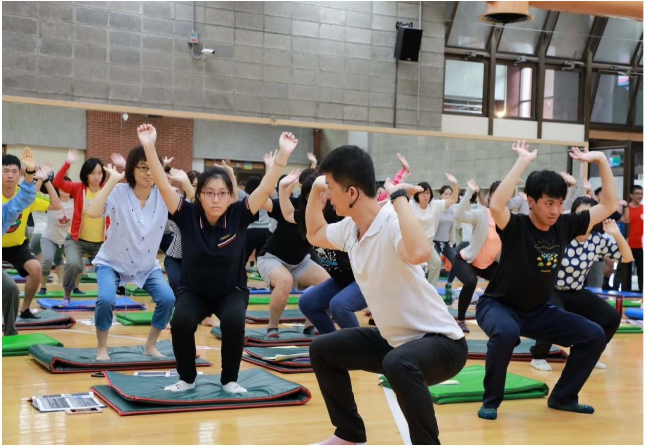
推展學校適應體育進階研習(下圖)