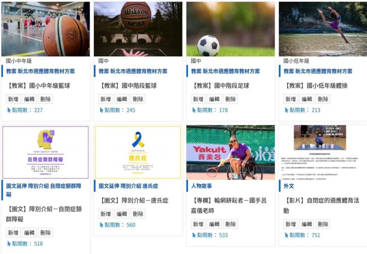
適應體育數位平臺(上圖及下圖)