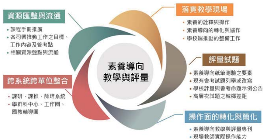
圖 1 「素養導向教學與評量議題小組」歷次會議關注面向