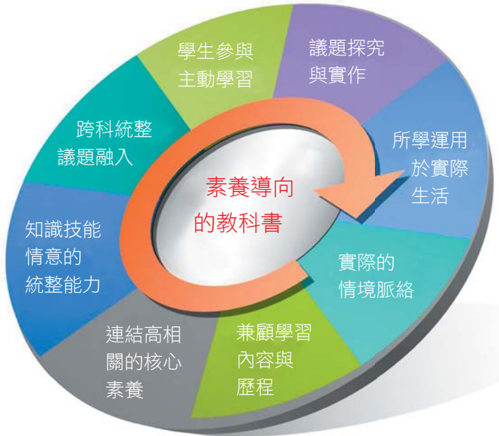
圖 2 素養導向教科書編寫原則及構念