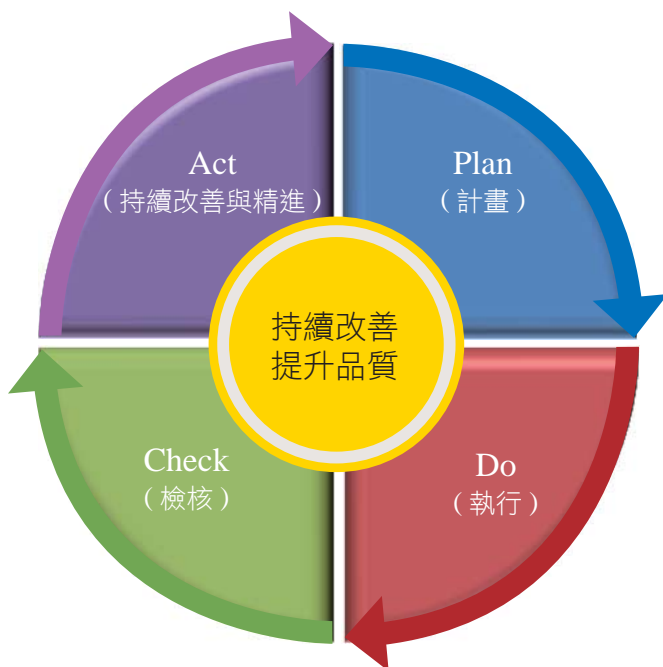
圖 1 PDCA (Plan-Do-Check-Act Cycle) 品質管理循環圖

「PDCA (Plan-Do-Check-Act Cycle) 品質管理循環」(如圖 1) 為協作中心「行政管考組」進行管考作業時所秉持之理念，旨在有效追蹤各司署、系統的執行情形，促其「持續改善，提升品質」，達成協作中心的任務。