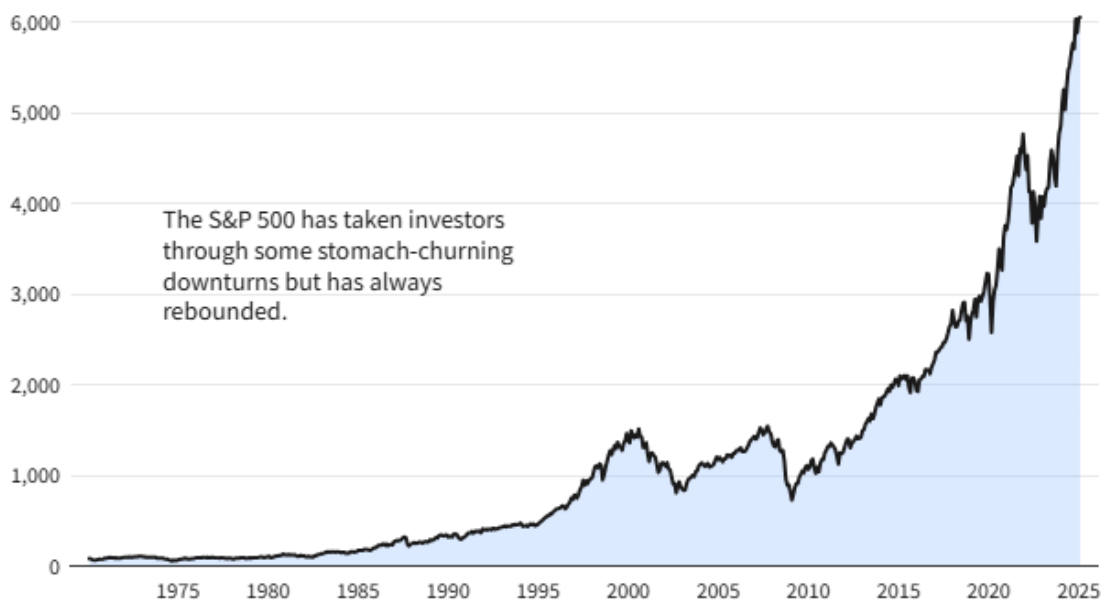
Ups and Downs of the S&P 500 (1970-2025)