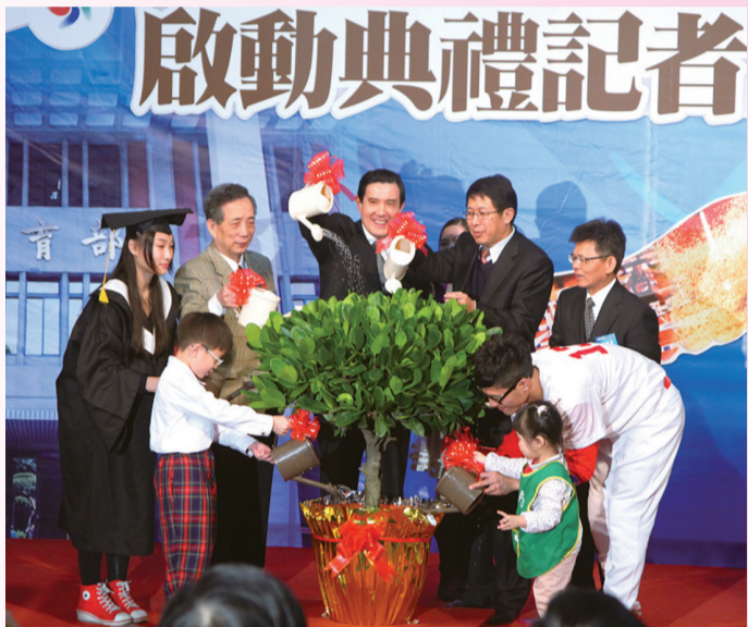
馬總統主持本部組改啟動典禮。

教育部表示，原本適用的組織法已經近40年沒有修訂，為了符應社會的變遷、國際的情勢及人民的期待，這次配合行政院組織改造，正可以進行大幅的調整，而且今(102)年1月1日施行的組織法也賦予教育部的內部組織更有彈性。這次的組改主要移出部分文化、衛福業務至文化部、衛生福利部，移入了體育、青年輔導的業務，在教育部成立了8司、6處、1會等15個1級單位，在附屬機關(構)部分成立了3署、11館(院)、1行政法人等15個行政單位(詳如教育部組織架構圖-2版)，將提供全國人民更優質的教育服務。