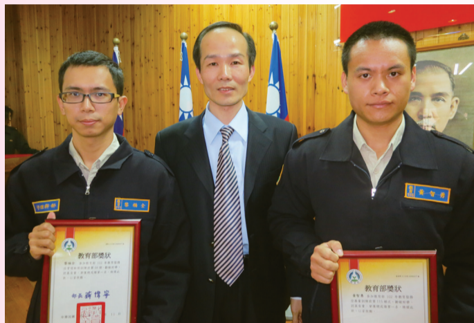
司長與管理幹部第一名(左)、專業訓練班第一名(右)合影