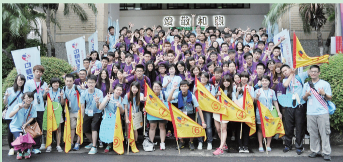
聽障學生歡樂手語營，引領聽障生做中學，深入人群體驗社會經驗。

教育部表示，為激勵聽障學生不受聽力限制，促進其社會參與、校園學習及生活適應能力與表現，特別針對聽障學生溝通學習的特性，量身打造暑期夏令營學習活動，讓聽障學子們在暑假期間也能享有豐富、多元的學習機會，不僅讓溝通學習不間斷，還能透過團體生活，學習到團體規範、增加人際互動，並擁有一段值得珍藏的豐富學習經驗與回憶！（特殊教育科黃蓓茹）