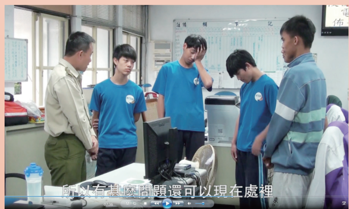
圖說：「毒來毒往」影片擷取畫面

回想在紫錐花反毒微電影拍攝過程中，當然不是說一切都很順利，我們遇到了下雨天，沒辦法到戶外拍攝、人手不足，四處找同學幫忙、對於拍攝的內容細節，出現意見分歧，導致有些摩擦。不過，就因為這樣，讓同學間的默契、感情變得更好，所以最後才能拍出這個作品，而能拍出這樣的作品也是因為大家都想讓其他人知道，千萬不要碰毒品，而能及早抽身，戒除毒癮，永遠都不會嫌太晚，使用毒品只會自毀前程，失去一切。希望我們的作品，能傳達給身邊的同學拒絕毒品的觀念，也能使那些濫用藥物的人覺醒，這才是比得獎還讓人更開心的事情！