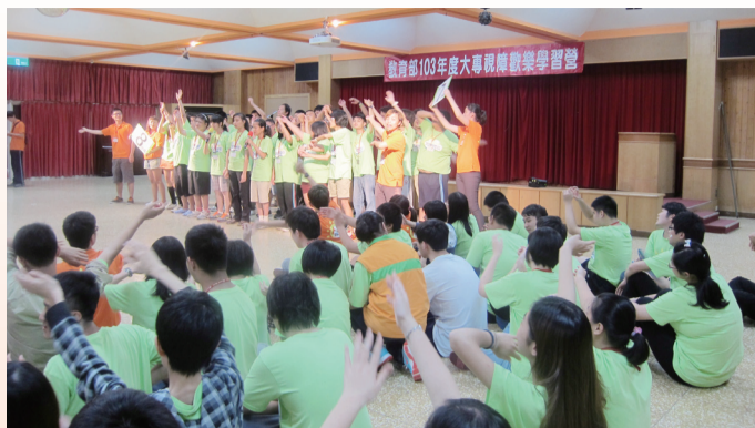
視障學生歡樂學習營，精彩活動引領視障生探索學習充實一夏。

教育部深切期許，所有與會學員能在「寓教於樂」的過程中快樂學習成長，並且提升自我認同與價值，進而促進視障學生未來積極邁向參與社會與提昇生活品質。（特殊教育科黃蓓茹）