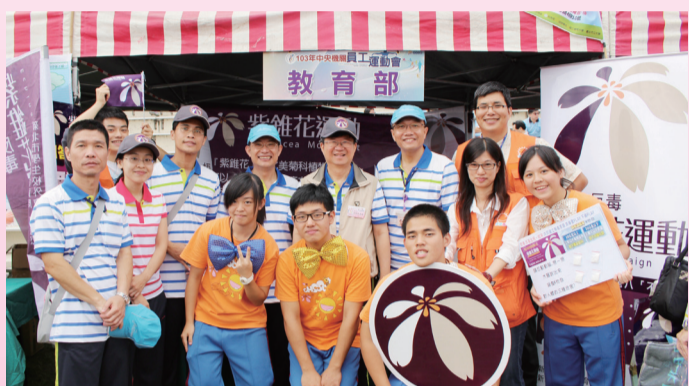
吳思華部長(中)肯定紫錐花運動反毒意念

為強化政府機關內部人員對紫錐花運動之反毒意念，教育部學生事務及特殊教育司特於10月4日在103年中央部會機關員工聯合運動會開幕典禮現場，協請新北市春暉志工及中和高中紫錐花社團，在寓教於樂中宣導紫錐花運動及增進中央機關內部人員反毒知能，有效落實教育宣導；教育部吳思華部長更親臨紫錐花運動宣導攤位了解相關宣導文宣，除表示支持紫錐花運動反毒意念