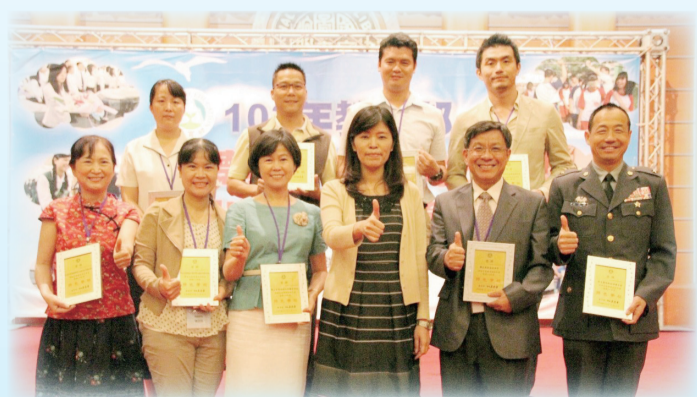
教育部常務次長林淑真與品德教育獲表揚學校代表合影

品德教育係政府長期重要施政目標，教育部「品德教育促進方案」，以「多元教學方法、學校落實推動、教師典範學習，品德向下扎根；師生成長、家長參與、民間合作，品德全民普及」為重點，透過鼓勵各縣市、各學校規劃因地制宜的策略，增進校內外資源整合，使品德教育由學校教育擴展到家庭教育與社會教育，讓社會更朝良善發展。(學生事務科 何依娜)