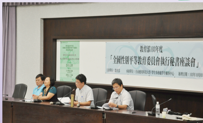
兩小無猜條款與成年兒少事件之案例分享

為使大專校院在推動性別平等教育工作的同時，更能有效發揮性別平等教育委員會與學校行政體系合作之功能，教育部期望透過辦理103年度全國大專校院性別平等教育委員會座談會，提供全國大專校院性別平等教育委員會專業交流及經驗分享之平臺，強化各校性別平等教育委員會委員與核心行政人員相關知能，進而整合校內各處室資源，以落實推動性別平等教育。(性別平等教育及學生輔導科 柯今尉)