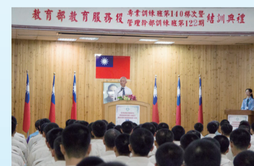
劉專門委員主持結訓典禮

最後，專門委員鼓勵役男，服役期間要有四項自我修鍊能力：第一、人際關係及團隊觀念的修鍊，第二、領導力、溝通能力及責任心的培養，第三、培養良好的體能，第四、終身學習。爾後無論大家在城市、偏鄉或外、離島服役，希望能順利並圓滿推動相關重要工作。（羅東高工 王惠玉）