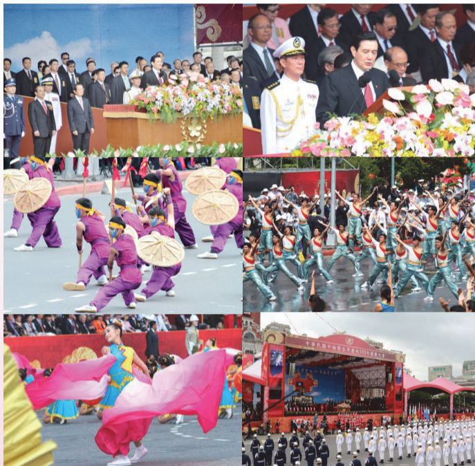
國慶大會以「序幕表演」、「慶祝大會」與「表演活動」三個階段進行，馬總統蒞臨會場致詞。

馬英九總統蒞臨會場致詞。本次大會國歌領唱由新竹縣桃山國小合唱團擔任；國慶禮讚則由「臺北銅管五重奏」擔綱演奏，曲目為「客家本色」、「天公落水」、「阮若打開心內的門窗」、「高山青」、「站在高崗上」等五首。在表演活動階段，首先由空軍雷虎小組七架次AT-3教練機採「大雁」隊形通過觀禮臺引領表演活動的開始，並恭賀國家慶典及帶動大會歡慶氣勢；隨後，大會也邀請桃園縣永平工商、高雄市三信家商、樹德家商、國立臺灣戲曲學院等學校，以傳統舞蹈、民俗舞蹈、現代舞蹈、健康舞蹈等表演方式，營造歡欣鼓舞、齊賀雙十之節慶氣氛，同時將活動帶至高潮。