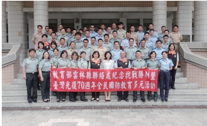
教育部學務特教司林曉瑩科長(圖中)出席臺灣光復70週年研討活動。