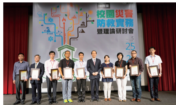
校園災害防救實務暨理論研討會表揚績優學校

校園災害防救運作機制與管理結合科技為創新作法，透過研討會的互動與學習，可使各級校園減災、防災工作之推動能達事半功倍之效。教育部期勉各縣（市）政府教育局（處）及大專校院能透過此研討會，瞭解推動