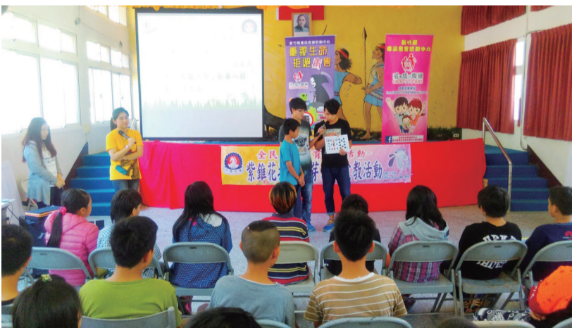
寓教於樂，中華大學反毒宣導同學深入偏鄉服務，散播反毒種子。

新竹中華大學日前辦理104年紫錐花運動「拒毒萌芽、入班宣教」系列活動，以偏鄉學校為宣導對象，學校反毒小天使們用實際行動，深入新竹縣尖石及五峰鄉等8所原住民小學實施入班宣教，服務450餘位國小學童，期望藉由此活動，提供國小學生們平時甚少獲得的反毒資源，讓反毒的種子向下扎根。（李鳳珠）