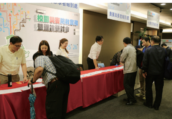
校園災害防救實務暨理論研討會報到

校園災害防救工作的重要性，並藉此提昇防災技能與規劃的能力，彼此學習，建立防災經驗分享網路，未來更可透過網路平臺資訊至各績優學校進行防災實兵演練與防災教育觀摩，以精進校園防災作為。（校園安全防護科 丁瑞昇）