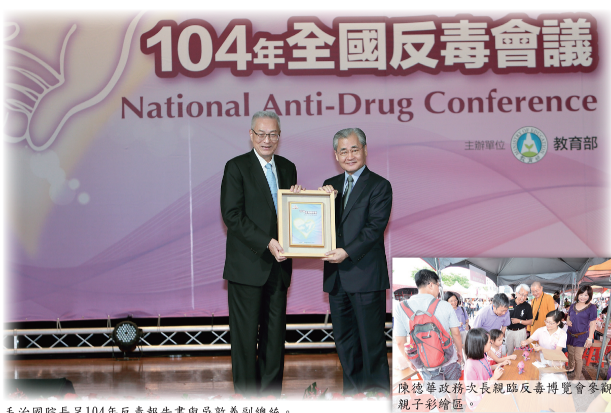
毛治國院長呈104年反毒報告書與吳敦義副總統。

會議」，由行政院毛治國院長主持，邀請吳敦義副總統蒞會，嘉勉中央部會、地方政府及民間團體等戮力反毒工作等400位嘉