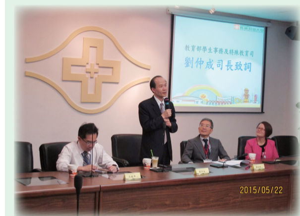
學生事務及特殊教育司司長劉仲成開幕致詞

為促進各大專校院學務長及與學輔人員交流，激發學務工作之創新思維與精進作法，長庚科技大學於104年5月22日辦理「北二區大專校院學務工作觀摩及學務創新經驗交流研習會」，教育部學生事務及特殊教育司劉仲成司長親臨會場與長庚科技大學樓迎統校長共同主持開幕，計有27個學校、60位學務長及學務工作夥伴參與，期結合校際資源觀摩學習，並成為相互支持的力量。