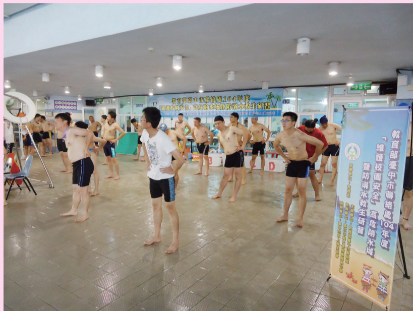
臺中市聯絡處辦理防溺水救生研習，說明水上救生要領並進行實務操作。

臺灣平均每年溺水狀況事件中，接近400人喪生，實足令人望而生畏，所以，教練呼籲學子