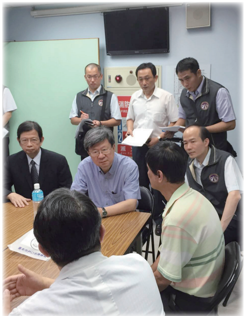
八仙塵爆造成兩百多名學生受傷，教育部啟動學生慰問、諮商輔導等緊急協助處置，圖為教育部吳思華部長赴醫院關懷學生與家屬。

行文教基金會為協助受創青年學子重回校園，於7月3日與教育部陳政務次會面表示，決定幫助有困難的受傷學生，補助學雜費，若是陸生在台就學，也可申請，以協助受創學生回歸正常生活及學習。而在諮商輔導工作部分，包括104年7月2日啟用諮詢電話專線(02-2365-3493分機10)安排專業諮商輔導人員提供電話諮詢服務，建置災後心理健康網站( http://care.heart.net.tw/ )提供心理健康相關資訊，共同協助受創學生的心理諮商輔導與課業輔導工作。 此外，教育部研訂了「攜手陪伴計畫」，運用學校輔導人員，規劃最適切的方式，協助學校以個案諮商輔導共同關懷及經常陪伴孩子，讓學習即早回歸正常。(校園安全防護科 王國偉)