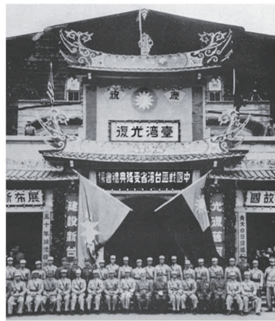
民國34年10月25日上午10時，於臺北公會堂（現為臺北市中山堂）舉行「中國戰區臺灣省受降典禮」。