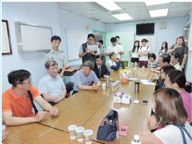
吳思華部長南下赴中國醫藥大學附設醫院探視慰問，表達教育界的關懷和祝福之意。（教育部電子報提供）