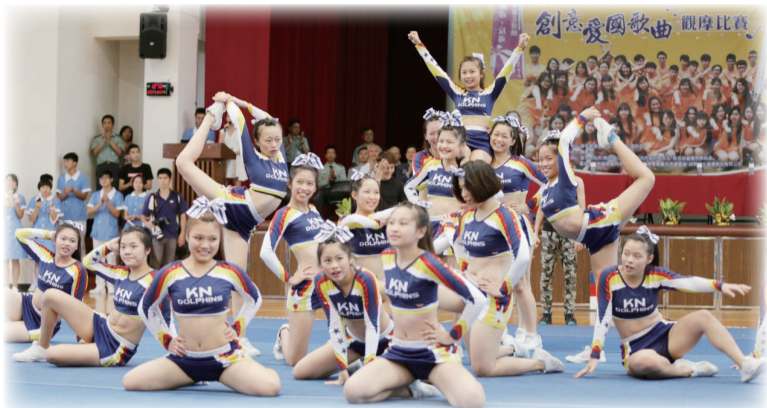
第1屆紫錐花盃創意愛國歌曲觀摩比賽17日在康寧醫護暨管理專科學校舉行，比賽過程中啦啦隊串場演出，增添活動效果。

為紀念七七抗戰暨台灣光復70週年及深化推動紫錐花運動，康寧醫護暨管理專科學校(康寧專校)與國防部、教育部假康寧專校共同合辦第一屆紫錐花盃創意愛國歌曲比賽嘉年華會，希望藉由