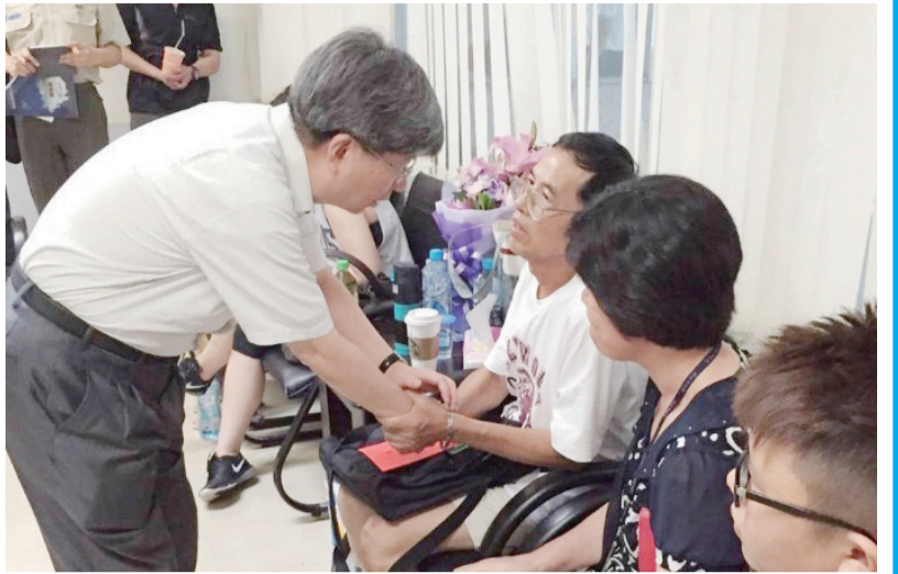
吳思華部長慰問世新、輔仁、文化、虎尾科大等共22位受傷學生的家屬並舉辦座談會。

【新北市訊】「學生所到之處皆是校園、全國教官服務全國學生」一直為軍訓同仁奉為圭臬的話語，此次八仙塵爆事件中，投入第一線協助的軍訓同仁，在這協助受傷學生、家屬的過程中，有相當多的感觸，整理部分新北市學校軍訓同仁感想，也謝謝在此次意外事件中全國默默付出的熱血教官。