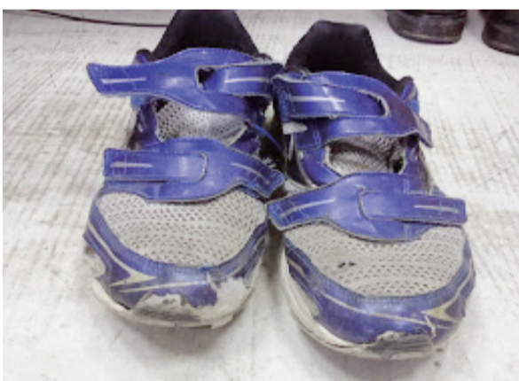
與黃生交換之運動布鞋