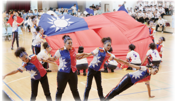
第1屆紫錐花盃創意愛國歌曲觀摩比賽17日在康寧醫護暨管理專科學校舉行，最後由能仁家商脫穎而出奪冠