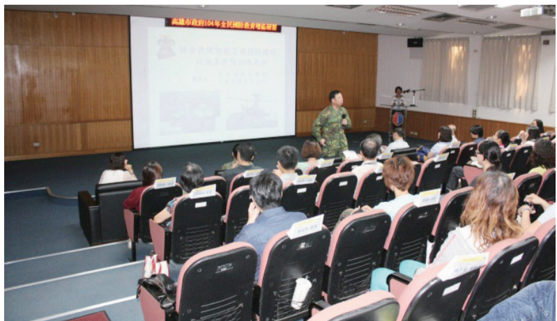
步訓部指揮官郭少將與參與研習同仁探討全民國防教育與國防建設。