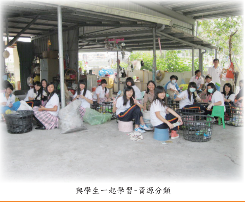
與學生一起學習~資源分類

雖然僅短短三個小時的課程，卻讓我對「催眠」有不一樣的認知。我想，「催眠」在輔導上的運用，應該如是說：「如何讓孩子打從心裡接受或接納你」，當他接受了你，才能引導他往正確的方向前進，也就是「催眠」成功了。