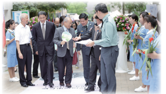
第1屆紫錐花盃創意愛國歌曲觀摩比賽第二會場(康寧廣場—歷史長廊)國防部解說員為與會貴賓說明七七抗戰迄今之中華民國歷史