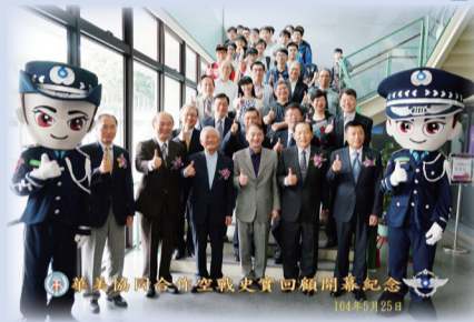
華美協同合作空戰史實回顧開幕紀念

中原大學為響應抗戰勝利70週年擴大紀念活動及推展全國民防教育，特協請社團法人中華戰史文獻學會提供「華美協同合作之空戰相關歷史檔案資料」，於5月25日至5月29日於學校聯合行政服務中心展出。