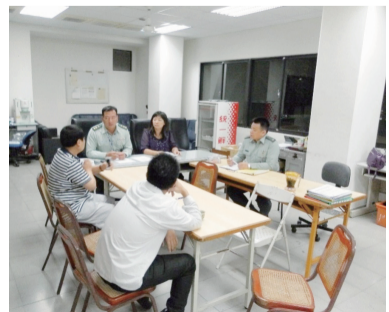
開會研討學生輔導工作

其實個人的力量是有限的，感謝學校及教官團隊常在我有需要支援時，能適時的調動有用的資源及助力，亦感謝很多的老師、職員甚至同學，願意在我需要的時候提供協助，有了他們的幫助，充份發揮了團體互助與合作的精神，才能讓我把學生的生活輔導教育工作做的更好。