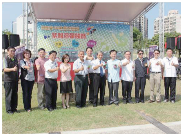
桃園市聯絡處漆彈競賽活動邀請副市長邱太三等來賓共同參與。

本次校際漆彈競賽，共有來自全市27所高中職校精英同學組成33個代表隊參與活動。邱副市長