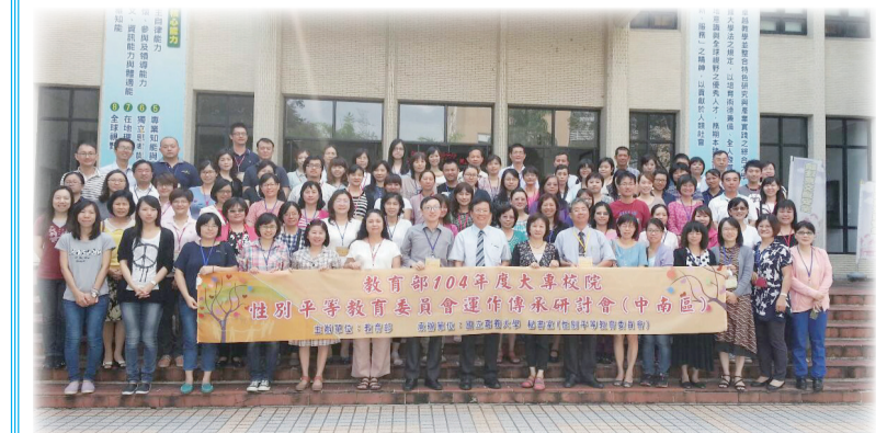
104年度大專校院性別平等教育委員會運作傳承研討會與會同人合影

教育部指出，希望各校性別平等教育委員會新任承辦人員能夠善用本部建置之「性別平等教育全球資訊網」、「性別平等教育季刊」等行政資源，結合校內專業師資及學生動力，一同營造性別平等的友善學習環境。（性別平等教育及學生輔導科 黃乙軒）