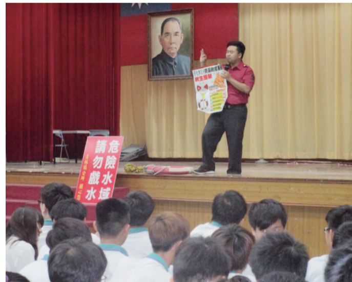
國立員林農工辦理「暑假災害防救活動」，邀請消防人員講授火災、戲水等安全知識，過程活潑生動。

最後，消防人員提醒所有師生應從平日就要建立危機觀念。活動從生動有趣的消防課程中潛移默化提醒學生減少事故的發生，並在平時就要建立應有的危機意識，危急時方能有效降低遭受傷害的可能性。（張博翔）