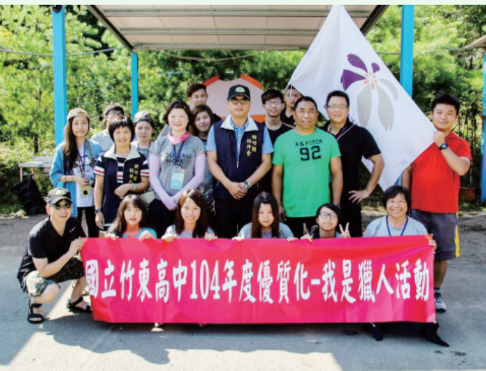
竹東高中辦理「我是獵人成長訓練營」，讓學生重新認識人文環境，並從體驗學習中建構人際互動網絡。

為鼓勵學員參與學習，設站過關活動亦精心設計搭配有獎徵答及摸彩活動，並實施隨機訪查及無記名問卷調查，問卷結果高達98%以上滿意度與普遍認同，活動圓滿成功，亦為今年「國家防災日」相關防震防災活動安全教育奠定良好基礎。（錢文彬）