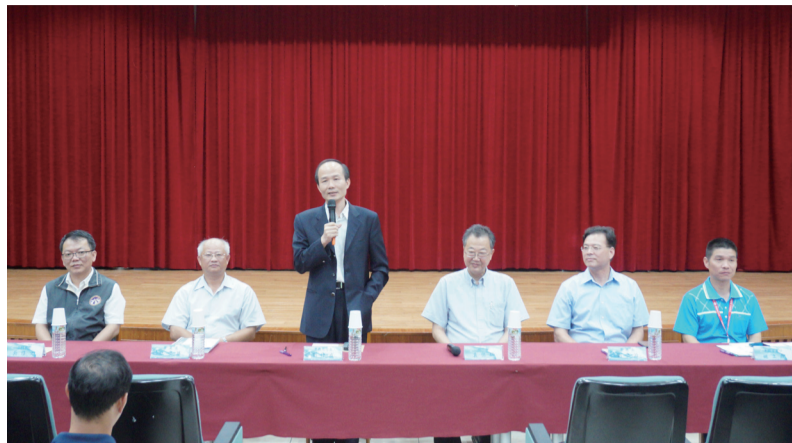
劉仲成司長於結訓典禮致詞勉勵

在受訓2週的課程包含專業知能、校安實務、體能訓練及其他等4個領域，課程有教育部校安政策說明、網路權益與資訊安全、學生事務架構與運作、賃居安全與相關法令探討、性別平等、校園性侵害或性騷擾事件處理（含相關法令）、基本輔導諮商技巧、校園事件之人權與法治知能（含個人資料保護法）、校園精神疾病與自殺危機管理（含緊急事件處理）、交通法令與事故處理、消防法令與校園火警案例檢討預防、深化紫錐花運動、學生事務輔導現況與相關輔導態度調整、通報作業程序及要領（含實務操作）、校園安全空間檢測（校安風水師）、校園防災