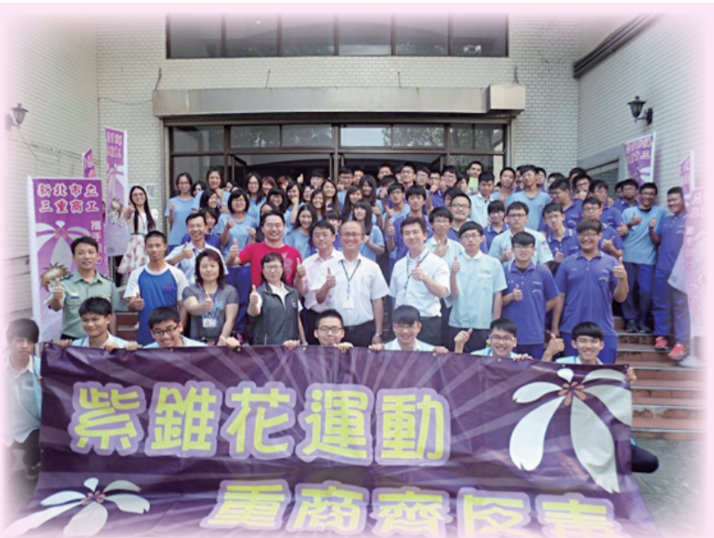
新北市辦理第3屆「反毒健康小學堂」有獎徵答活動，成效顯著。

作小點心和小瑋分享。在12次的學習課程中，志工媽媽的溫暖不但融化了小瑋，也引導他看到自身的優點。隨後小瑋變得越來越有信心，更參加學校棒球隊找到人生的樂趣。在志工媽媽及學校師長的鼓勵下，他努力練習投球技巧，把全部的精神都放在棒球運動，甚至連菸都戒了。俗話說：「機會是給準備好的人」，在小瑋對棒球投出生命的熱情時，上天也回贈他一份用汗水換來的禮物—就是他憑自身的實力，考上國立學校的棒球隊投手。對小瑋而言，無疑是最大的鼓舞和正面的示範。（張加慧）