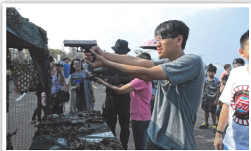
生存遊戲射擊體驗

能來軍港參觀讓我印象非常深刻，不單單只是認識各類的戰艦、運輸艦和武器，我覺得更值得一提的是國軍展現了與印象中不一樣的形象，每位國軍都親切的對待參訪遊客，也看得出來國軍為了今天的表演要呈現最好的一面，每天都努力的練習操演。最後，希望在未來，我也能成為像他們一樣為他人努力的人。