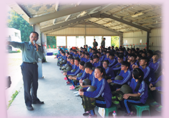
玉山高中實彈射擊前教育訓練情形

當天下午同學們高興地搭車前往靶場，到達靶場後仔細聆聽教官的解說，並在國軍弟兄及學校教官支援下順利完成此次活動。每位同學從踏進