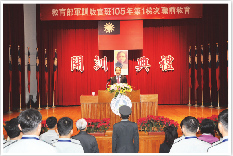
教育部 105 年第 1 梯次軍訓教官職前教育開訓典禮現場

藥物濫用的成因複雜，且學生藥物濫用多在校外，教育部呼籲家長在工作忙碌之餘，也應多加關懷、支持與陪伴學生，並留意交友及生活作息，共同攜手保護學子身心健康。反毒運動更需要全面而長期的推動，希望全民共同關注防制毒品議題，響應紫錐花運動，以期維護國人身心健康及安全友善的校園。(校園安全防護科 丁瑞昇)