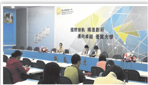
大專校院推動情感教育課程教學及活動觀摩研習現場

極的推動，讓學生能夠認識情感關係 (包含愛情、友情及親情)，進而發展出優質、平等與負責任的情感關係，同時引導學生思考情感關係對自我的意義，並能以適切的態度，表達情感、接受情感或拒絕情感，也能具備溝通協商與情緒管理的能力。(性別平等教育及學生輔導科 邱玉誠)