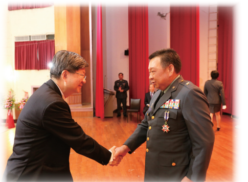
圖 1 吳部長為元旦晉升軍訓同仁授勳。 圖 2 吳思華部長於典禮中頒發二星忠勤勳章予邱國樑將軍，肯定其工作服務表現。 圖 3 吳思華部長與軍訓同仁合影。

教育部 105 年元月軍訓教官頒授忠勤勳章暨晉任授階典禮於 104 年 12 月 29 日假國立華僑高級中學辦理，典禮由教育部吳思華部長親臨主持，學務司劉仲成司長、新北市教育局黃靜怡副局長及相關大專校院及高中職校校長等貴賓應邀觀禮，本次典禮計有邱國樑將軍等 2 員服務滿 30 年以上績效卓著獲頒二星忠勤勳章，黃朝聰上校等 266 員服務滿 10 ~ 20 年以上，績效卓著獲頒忠勤及一星忠勤勳