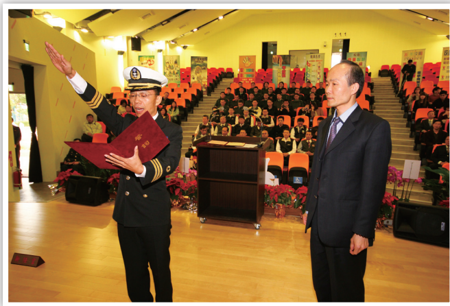
新任官吳督導宣示

及共創的「五共」教育團隊為願景，為自己增能，為單位加分，更為孩子的未來而努力！（新竹市聯絡處 彭郁芝）