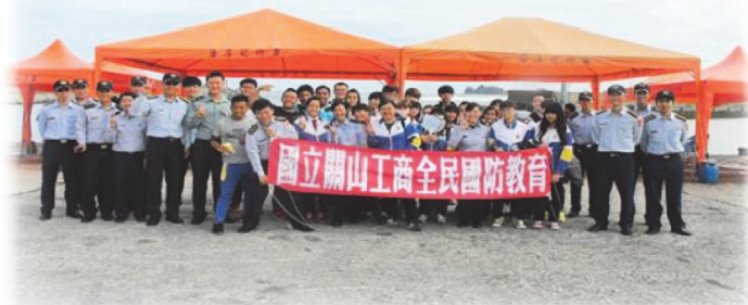
台東關山工商參訪海巡署並觀摩港區救援教學示範