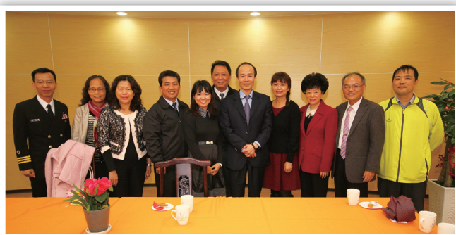
學務特教司司長與督導及校長合影