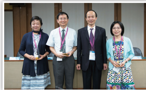
頒獎—友善校園獎 / 優秀導師

再者，議程也安排逢甲大學建築系高敬賢助理教授講授「『好地方』是活的動詞」之專題演講，透過闡述學習空間如何具備巧思來規劃設計，以增加空間功能的多元多樣性及使用效率，進而提升學生學習品質及行為素養；另外，也邀請到國立臺中教育大學特殊教育中心王欣宜主任講述「大專校院特殊教育的現況與發展」，以增進學務工作者面對日趨多元之特教學生有