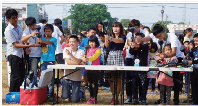
茄萇國小校長帶領實施漆彈定靶射擊情形。

國立勤益科技大學日前利用週末假日假彰化縣芬園鄉茄萇國小辦理菁英小樹苗營隊活動，入校帶動茄萇國小的學童瞭解全民國防教育目的及毒品危害與拒毒技巧，期藉由本次活動將全民國防教育及反毒意識種子深耕、生根於校園，為學子營造清新健康的學習環境及凝聚學生愛鄉愛土、保家衛國之共識。