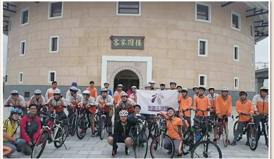
苗栗農工辦理健康騎乘活動，展現生命活力與重視交通安全觀念。

紫錐花運動精神外，也結合了道路交通安全概念，讓參與同學都能瞭解遵守交通規則就是愛人愛己的表現。一路上大家遵守交通號誌，也趁機向社區大眾宣揚生命教育的可貴。(張志傑)