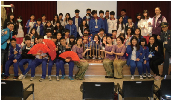
萬華新移民會館暨區史展示中心與老師合影

中午吃著龍山寺周邊的小吃，再回到臺北捷運地下街踩著多采多姿的繁華景象！每一位同學懷著好奇與期待，也用第一次搭高鐵探險的心態，在臺北創造出美好的回憶。夜幕低垂了！高鐵載著幸福滿滿的孩子們回到彰化田中。今天我們知道新移民的孩子都很棒，因為，我們是優秀的新臺灣之子，更是臺灣未來的新力量。