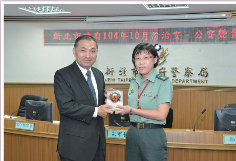
朱如蘭教官於 104 年 10 月 28 日治安會報中接受侯友宜副市長公開表揚