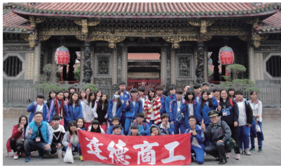
龍山寺前全體合影