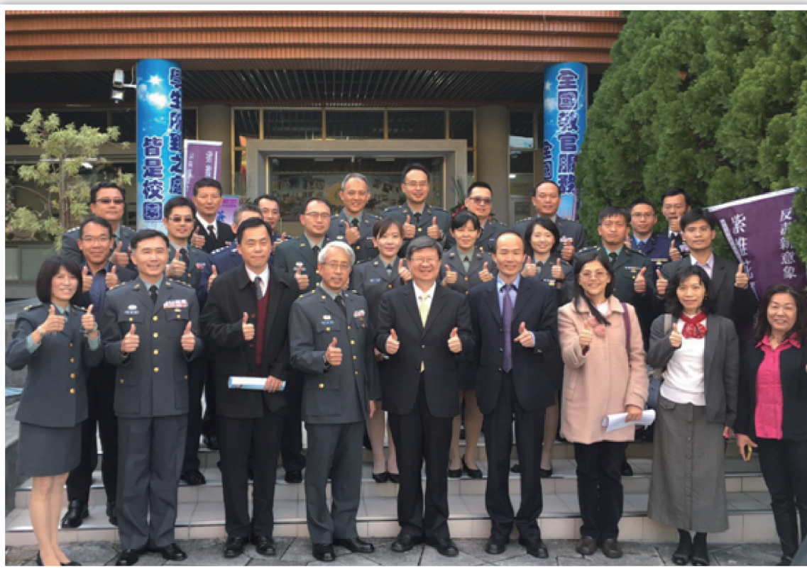
吳思華部長與軍訓同仁合影。

最後，吳部長勉勵在座的每一位新進教官，進入校園之後，都能成為一位具有「愛與榜樣及感動」的軍訓教官，為建構友善校園共同努力，提供學校師生更好的協助與服務。(國立家齊女中 尤喬誼)