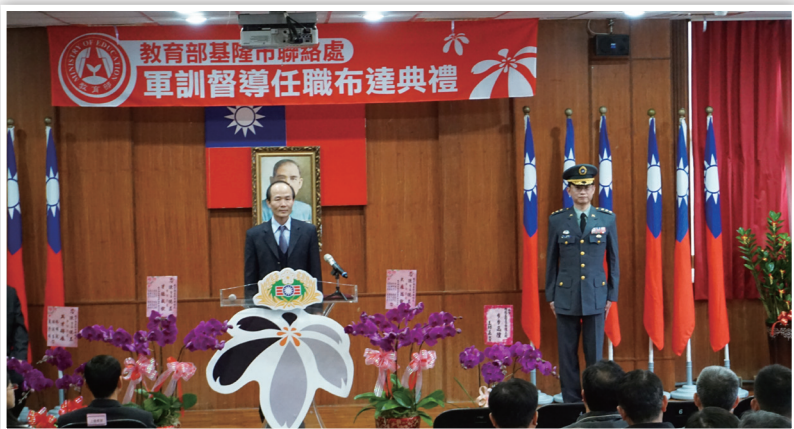
劉仲成司長主持教育部基隆市聯絡處軍訓督導任職布達典禮。

最後，劉司長勉勵基隆市聯絡處全體軍訓同仁在新任軍訓督導的帶領下，能夠延續以往的優良傳統，精益求精，秉持全國教官服務全國學生的精神與信念，持續推動全民國防教育與校園安全工作，並盡心為學校師生提供服務。(國立基隆高中 方富俞)