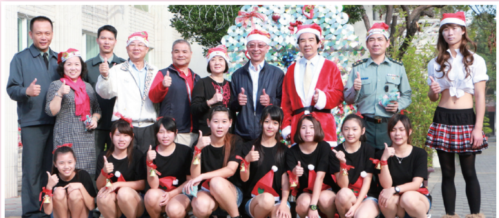
育德工家辦理「獅獻瑞讚育德，響鈴嘹亮慶聖誕」友善校園活動，廣受各界好評。