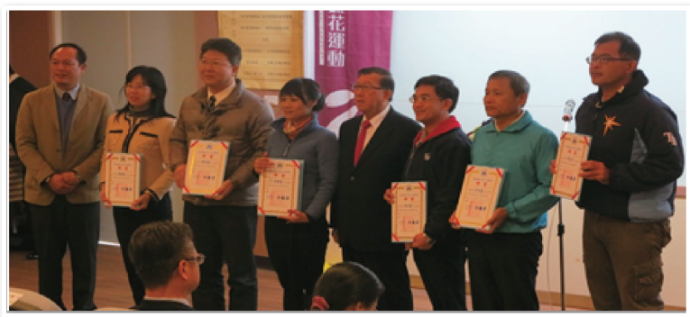
檢討會議中表現優良學校頒獎實況。